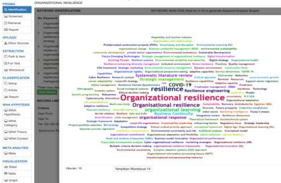
Gambar 2. Hubungan antar Kata Kunci Melalui VOSviewer

mencakup deskripsi umum informan, jumlah informan, kondisi lokasi penelitian, serta hasil temuan dalam bentuk teks, tabel, dan grafik untuk memperjelas temuan utama.