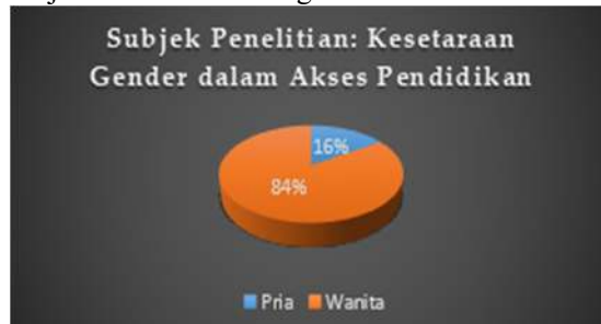
Tabel 1. Distribusi Subjek Penelitian tentang Kesetaraan Gender dalam Akses Pendidikan

Membahas subjek penelitian, penelitian ini menggunakan mahasiswa dari dua universitas: Universitas Langlangbuana dengan total 57 mahasiswa yang terdiri dari 6 pria dan 51 wanita, dan Universitas Terbuka dengan total 196 mahasiswa yang terdiri dari 31 pria dan 165 wanita. Dari grafik di atas, terlihat bahwa jumlah mahasiswa perempuan lebih dominan. Peran beberapa mahasiswa perempuan ini mendominasi dalam kegiatan akademik dan non-akademik. Misalnya, mahasiswa berprestasi dan menjadi ketua himpunan mahasiswa.