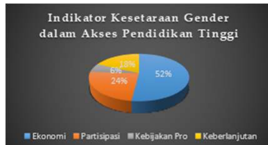
Tabel 2. Indikator Kesetaraan Gender dalam Akses Pendidikan

Membahas subjek penelitian, penelitian ini menggunakan mahasiswa dari dua universitas: Universitas Langlangbuana dengan total 57 mahasiswa yang terdiri dari 6 pria dan 51 wanita, dan Universitas Terbuka dengan total 196 mahasiswa yang terdiri dari 31 pria dan 165 wanita. Dari grafik di atas, terlihat bahwa jumlah mahasiswa perempuan lebih dominan. Peran beberapa mahasiswa perempuan ini mendominasi dalam kegiatan akademik dan non-akademik. Misalnya, mahasiswa berprestasi dan menjadi ketua himpunan mahasiswa.