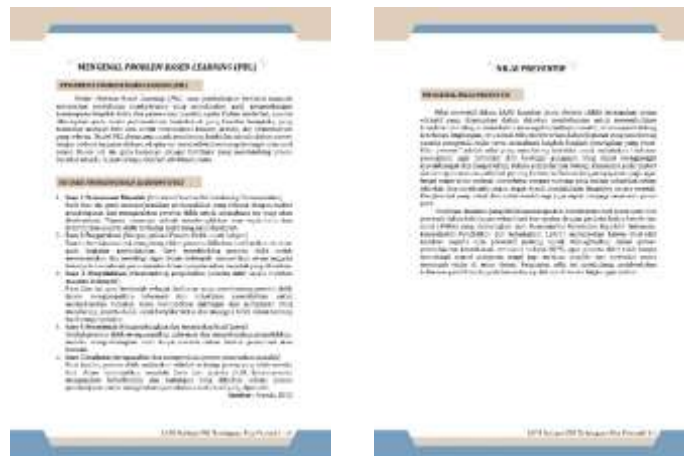
Gambar 2. Tampilan Sintaks PBL untuk Langkah Kegiatan dan Nilai Preventif