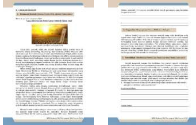
Gambar 3. Langkah Kegiatan LKPD