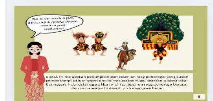
Gambar 6. Kesenian Reog Ponorogo

Pada gambar di samping ini menampilkan bahwa tokoh elin melihat kesenian reog Ponorogo dan ini merupakan kearifan budaya lokal di Jawa atau lebih tepatnya berasal dari namanya itu sendiri yaitu daerah Jawa Timur di kota Ponorogo