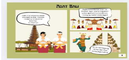
Gambar 7. Adat Bali

Dan untuk gambar di samping elin dan juga Ali sudah sampai di Pulau Bali dan melihat penampilan tari legong dan juga upacara ngaben