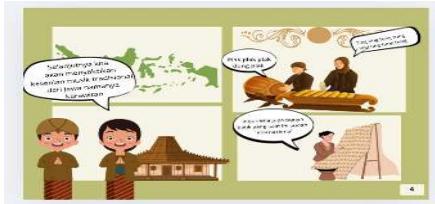
Gambar 5. Adat Jawa musik tradisional

Pada gambar di samping ini elin masih berada di daerah Jawa dan juga menampilkan pembuatan batik serta melihat penampilan musik Jawa yaitu karawitan