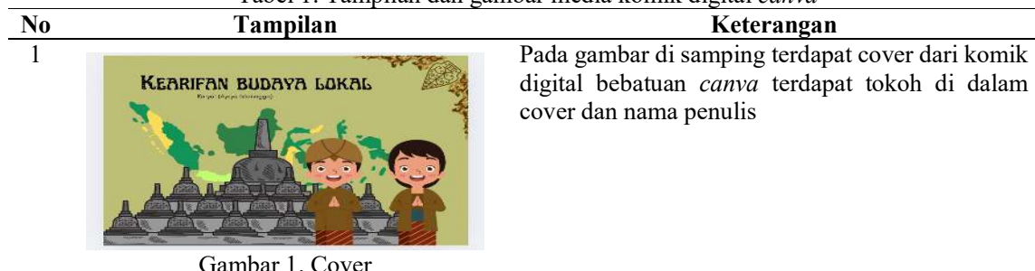
Gambar 1. Cover