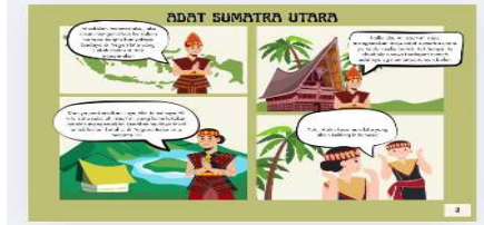
Gambar 3. Adat Sumatra Utara

Pada gambar disamping memulai elin dan Ali sudah sampai di Sumatera Utara dan berpakaian adat Sumatera Utara