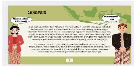
Gambar 2. Sinopsis & Pengenalan tokoh

Pada gambar disamping terdapat awal percakapan ataupun pengenalan tokoh, serta sinopsis atau jalan cerita komik digital ini.