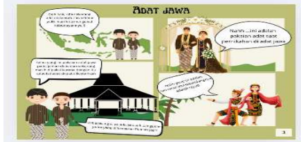
Gambar 4. Adat Jawa

Pada gambar disamping elin dan Ali sudah sampai dan berganti pakaian yaitu adat Jawa iya mengenakan rumah tradisional Jawa, tarian dan pakaian adat Jawa