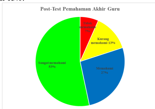
Gambar 2 Hasil Post-Test Pemahaman Akhir Guru

Setelah kegiatan selesai, terjadi pergeseran signifikan. Jumlah responden yang menyatakan sangat memahami meningkat menjadi 53%, sementara yang menyatakan tidak memahami menurun drastis menjadi 7%. Responden yang menyatakan memahami tetap di angka 27%, dan kategori kurang memahami menurun menjadi 13%.