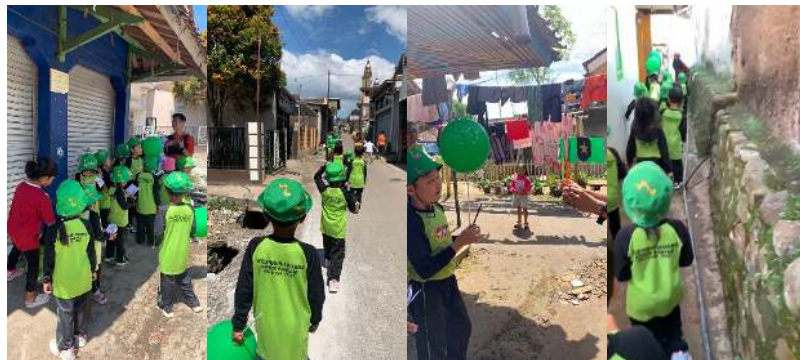
Gambar 3, 4, 5, dan 6. Mencari Jejak

Anak dibagi dua kelompok (rute berbeda). Selama perjalanan mencari jejak anak dibekali buku saku yang di dalamnya terdapat tugas; menghitung jumlah hewan, masjid, warung, dan teman sekelompok. Dalam sela-sela perjalanan, guru mengadakan kuis (Kelompok 1: Materi Pancasila dan Kelompok 2: Materi Rukun Islam). Guru membawa bendera lambang materi (pancingan juga disiapkan). Adapun aturan bermain jejak ini anak harus mampu berjalan tertib, santai, bersuara rendah, boleh menyanyi/yel-yel.