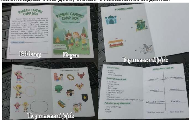
Gambar 1 dan 2. Buku Saku

Penyerahan sama oleh orang tua dilakukan di gerbang sekolah dengan teknis orang tua menandatangani penyerahan anak serta pemberian buku saku (Gambar 1. dan 2.) kepada anak dan penjelasan mengenai buku saku kepada orang tua. Buku saku bukan sekadar catatan, tetapi menjadi alat belajar, refleksi, dan komunikasi antara anak, guru, dan orang tua selama kegiatan camping . Ini adalah pendekatan yang cerdas dan menyenangkan untuk kegiatan PAUD berbasis pengalaman langsung. Manfaat buku saku dalam camping ini sebagai panduan kegiatan, monitoring aktivitas anak, evaluasi personal anak, media komunikasi ke orang tua, meningkatkan motivasi anak agar ikut dalam setiap kegiatan karena ingin ditandatangani oleh guru, sarana dokumentasi kegiatan.