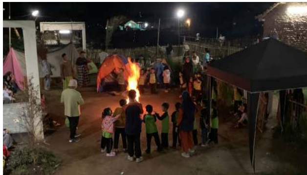
Gambar 3, 4, 5, dan 6. Pelaksanaan Api Unggun

Sebagai penutup dari seluruh rangkaian kegiatan Rabbani Camping camp , dilaksanakan kegiatan puncak berupa penyalaan api unggun yang berlangsung pada pukul 19.00 hingga 19.30 di halaman sekolah. Dalam kegiatan ini, anak-anak bersama guru berkumpul membentuk lingkaran di sekitar api unggun yang telah disiapkan sebelumnya. Orang tua kembali hadir untuk menemani anak-anak menyaksikan momen hangat dan penuh makna ini, setelah sebelumnya berperan dalam mengantar makanan pada pukul 16.00.