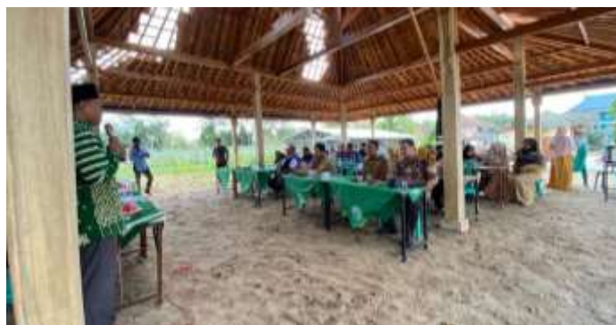
Gambar 3. Pendampingan penyusunan pembukuan usaha Pokdakan MBS Al-Manar

Pada kegiatan penyuluhan didapati bahwa sasaran suluh (anggota pokdakan) sangat antusias mengikuti paparan materi yang disampaikan oleh pengabdian. Beberapa anggota pokdakan menyatakan bahwa pengetahuan dan teknik penyusunan pembukuan usaha yang diberikan pengabdian sangat bermanfaat dalam rangka pengelolaan yang lebih baik terhadap modal usaha, biaya operasional, serta penerimaan usaha budidaya. Setelah kegiatan penyuluhan, anggota pokdakan mendapatkan pelatihan