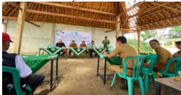
Gambar 2. Pelaksanaan penyuluhan pembukuan usaha

Pelaksanaan kegiatan pengabdian kepada masyarakat di Pokdakan MBS Al-manar Desa Kepayang Kec. Lepmuing Kab. Ogan Komering Ilir terdiri dari penyuluhan dan pelatihan. Penyuluhan dilaksanakan di pengelola pokdakan, dengan tujuan untuk menjelaskan secara lengkap teori dan teknik penyusunan pembukuan usaha. Materi penyuluhan disajikan dalam bentuk ceramah dan dilengkapi dengan brosur sehingga diharapkan dapat meningkatkan daya serap dan pemahaman anggota pokdakan. Pada bagian akhir penyuluhan dilakukan diskusi dan tanya jawab dengan tujuan agar anggota pokdakan memperoleh penjelasan secara lengkap sesuai dengan kondisi usaha yang dijalankannya, serta menyampaikan kendala-kendala dalam manajemen usaha budidaya yang mereka kelola (Gambar 2).