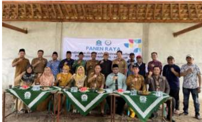
Gambar 1. Pertemuan dan konsultasi awal pelaksana pengabdian dengan Pokdakan MBS Al-manar Desa Kepayang Kec. Lepmuing Kab. Ogan Komering Ilir

Pelaksanaan kegiatan pengabdian kepada masyarakat di Pokdakan MBS Al-manar Desa Kepayang Kec. Lepmuing Kab. Ogan Komering Ilir terdiri dari penyuluhan dan pelatihan. Penyuluhan dilaksanakan di pengelola pokdakan, dengan tujuan untuk menjelaskan secara lengkap teori dan teknik penyusunan pembukuan usaha. Materi penyuluhan disajikan dalam bentuk ceramah dan dilengkapi dengan brosur sehingga diharapkan dapat meningkatkan daya serap dan pemahaman anggota pokdakan. Pada bagian akhir penyuluhan dilakukan diskusi dan tanya jawab dengan tujuan agar anggota pokdakan memperoleh penjelasan secara lengkap sesuai dengan kondisi usaha yang dijalankannya, serta menyampaikan kendala-kendala dalam manajemen usaha budidaya yang mereka kelola (Gambar 2).