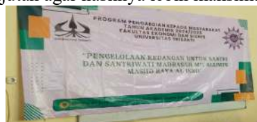
Gambar 1. Spanduk Kegiatan PkM di Madrasah Mu'allimin Masjid Raya Al. Isro. Tanjung Duren Utara, Jakarta Barat

Di penghujung kegiatan, Tim bersama mitra melakukan evaluasi dan pemantauan untuk memberikan jawaban mengenai fenomena pentingnya kesadaran dalam perencanaan keuangan peserta. Tim juga mendapatkan masukan dari mitra, untuk pelaksanaan kegiatan yang akan datang yang bersifat berkelanjutan agar hasilnya lebih maksimal bagi mitra.