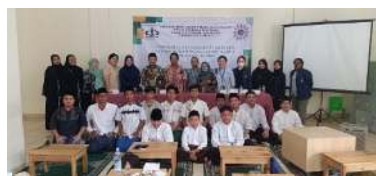
Gambar 2. Santri, Pengurus dan peserta PkM.