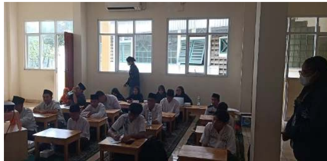
Gambar 3. Suasana Kelas

Dari 18 orang peserta yang pada awalnya tidak memahami bagaimana merencanakan keuangan, apa gunanya serta apa tujuannya kemudian setelah evaluasi maka 90% atau 16 dari santri dapat memahami semua hal terkait perencanaan keuangan sementara sisanya 10% atau 2 santri dapat memahami sebagian besar materi yang di ajarkan.