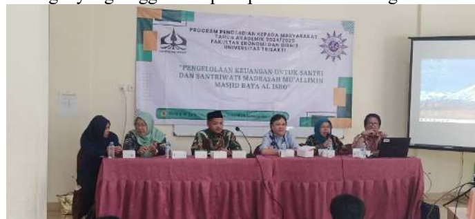
Gambar 4. Para pembicara dan Pengurus Pesantren.