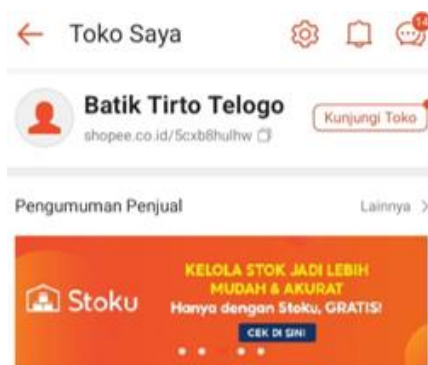
Gambar 4 Akun Shoppe “Batik Tirto Telogo”

Kegiatan pendampingan yang kami lakukan di Kampung Batik RW 10 Kelurahan Bunulrejo adalah memperkenalkan pengrajin batik tulis media sosial seperti Whatsapp Bussines , Instagram, dan Shopee sebagai sarana digital marketing. Media-media ini dipilih karena selain biaya yang dikeluarkan lebih murah dan tidak membutuhkan keahlian khusus dalam pembuatannya, media-media ini juga dianggap mampu langsung meraih konsumen karena sangat umum digunakan di masyarakat.