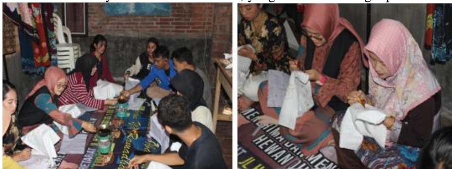
Gambar 6 Kegiatan Pelatihan Batik bersama Masyarakat

Kegiatan Pelatihan dasar batik tulis dan pameran produk batik khas Kampung Batik RW 10 Kelurahan Bunulrejo dibuka untuk umum dengan target peserta adalah generasi muda, yang tujuannya adalah untuk menumbuhkan semangat para pemuda untuk melestarikan budaya membatik. Disamping itu kami juga mem-pamerkan hasil produk batik khas “Tirto Telogo” yakni batik khas Kampung Batik RW 10 Kelurahan Bunulrejo. Kegiatan ini dipandu oleh ibu-ibu pengrajin batik tulis masyarakat Kampung batik sendiri khususnya ibu lis orbaniarti SE, yang bertindak sebagai pemateri utama.