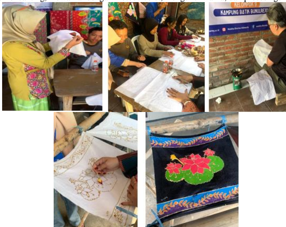
Gambar 7. Proses dan Hasil Kegiatan Pelatihan Membatik

kami juga berperan sebagai pendamping bagi peserta-peserta yang mungkin mengalami kesulitan selama pelatihan. Materi yang disampaikan mencakup penjelasan tentang sejarah batik di tingkat nasional dan internasional, sejarah batik di kelurahan Bunulrejo, serta latar belakang motif batik khas kampung batik RW 10 selain itu, pemateri juga memperkenalkan berbagai alat dan bahan yang digunakan dalam proses membatik, serta menjelaskan tahapan pembuatan batik tulis, yaitu menggambar pola dasar, mencanting, mewarnai dengan metode colet, mengunci warna, dan proses nge-lorod.