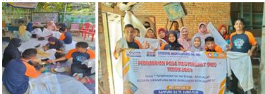
Gambar 1 Menyanting bersama warga di Kampung Batik RW 10

utama yang dihadapi adalah kurangnya regenerasi pembatik muda, dominasi usia lansia dalam proses produksi, dan keterbatasan dalam memanfaatkan teknologi digital sebagai media pemasaran. Jika tidak diatasi, kondisi ini dapat berdampak pada menurunnya produktivitas serta mengancam keberlanjutan warisan budaya tersebut.