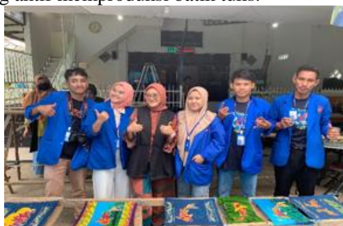
Gambar 5 Kegiatan Pelatihan Batik

Pelatihan Membatik bersama ibu-ibu PKK dan lansia masyarakat Kampung Batik yang tujuan utamanya adalah menghidupkan kembali budaya membatik di Kampung Batik RW 10 Kelurahan Bunulrejo. Penurunan produktifitas pengrajin batik tulis di Kampung Batik RW 10 Kelurahan Bunulrejo juga dilatarbelakangi oleh jumlah pengrajin batik tulis yang berkurang setiap tahunnya. Berdasarkan data jumlah pengrajin batik tulis di Kampung Batik RW 10 Kelurahan Bunulrejo, pada tahun 2024 hanya terdapat 4 pengrajin batik yang aktif memproduksi batik tulis.