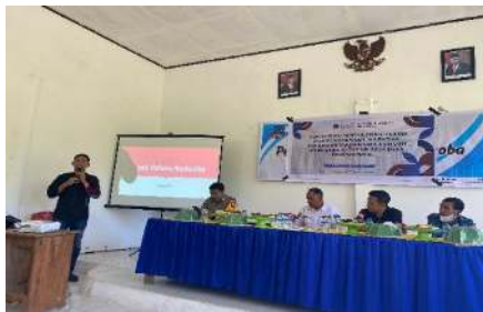
Gambar 1. Pelaksanaan Kegiatan Pencegahan Narkoba

Kegiatan sosialisasi pencegahan narkoba di Desa Iwoimopuro diawali dengan pemaparan materi mengenai pengertian, jenis-jenis, serta dampak penyalahgunaan narkoba terhadap kesehatan fisik, mental, dan sosial masyarakat. Peserta yang terdiri dari anak-anak, remaja, serta perwakilan masyarakat diberikan pemahaman mendalam mengenai bahaya narkoba yang dapat merusak masa depan generasi muda. Penyampaian materi dilakukan dengan metode ceramah interaktif, sehingga memungkinkan terjadinya dialog dua arah yang aktif dan membangun. Setelah sesi pemaparan materi, kegiatan dilanjutkan dengan diskusi kelompok yang melibatkan peserta secara langsung. Dalam sesi ini, peserta diajak untuk berbagi pandangan dan pengalaman yang berkaitan dengan isu narkoba di lingkungan sekitar. Diskusi ini bertujuan untuk menggali pemahaman masyarakat mengenai realitas penyalahgunaan narkoba di daerah mereka sekaligus menemukan strategi pencegahan yang paling sesuai dengan kondisi SETEMPAT. Selain ceramah dan diskusi, dilakukan pula sesi tanya jawab serta simulasi sederhana yang menggambarkan konsekuensi hukum dan sosial dari penyalahgunaan narkoba. Kegiatan ini memberikan kesempatan kepada peserta untuk memahami peran masing-masing dalam mencegah peredaran narkoba di lingkungan mereka. Antusiasme dan partisipasi aktif masyarakat menjadi indikator keberhasilan awal program ini, sekaligus menunjukkan bahwa sosialisasi semacam ini sangat dibutuhkan oleh masyarakat Desa Iwoimopuro.