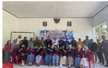
Gambar 2. Foto Bersama Aparat Dan Masyarakat Desa Mopuro

Setelah dilaksanakannya sosialisasi mengenai aspek hukum narkoba, hal ini diharapkan dapat menjadi pembelajaran bagi masyarakat desa Iwoimopuro untuk menghindari penggunaan narkoba. Aturan hukum terkait narkoba sangat penting karena narkoba memiliki dampak buruk yang signifikan bagi individu, keluarga, dan masyarakat. Penyalahgunaan narkoba dapat merusak organ tubuh, menimbulkan gangguan mental, bahkan mengakibatkan kematian. Selain itu, peredaran narkoba juga berpotensi memicu tindak kejahatan lain dan pembunuhan.