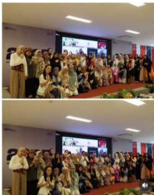
Gambar 4. Dokumentasi Foto Peserta Kegiatan.