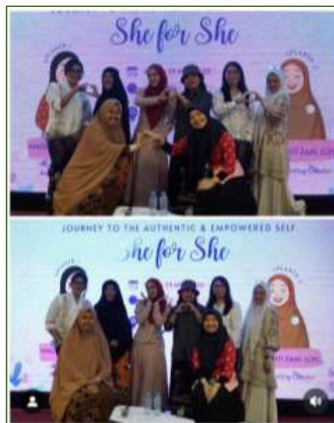
Gambar 3. Dokumentasi Foto Pembicara dan Pelaksana Kegiatan

Lebih jauh, kegiatan ini menunjukkan bahwa intervensi psikososial yang berbasis nilai budaya lokal dan pengalaman kolektif dapat menjadi strategi kontekstual yang efektif dalam mendukung pemberdayaan perempuan profesional di era modern (Gilligan & Snider, 2020; Sandberg & Grant, 2020).