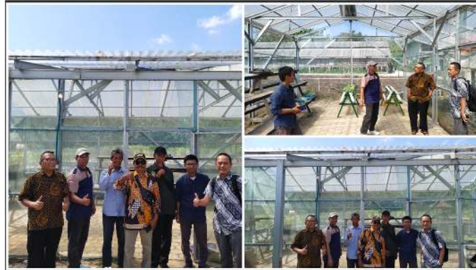
Gambar 2. Kunjungan observasi bersama tim pelaksana dan mitra

Hasil peninjauan menunjukkan bahwa secara teknis lokasi memenuhi beberapa syarat penting, seperti tersedianya ruang terbuka, sinar matahari yang cukup sepanjang hari (mendukung efisiensi panel surya), serta aksesibilitas yang baik untuk kegiatan edukatif. Beberapa catatan dari peninjauan adalah perlunya pemadatan lahan dan pengukuran ulang luasan area yang tersedia untuk menentukan skala greenhouse yang ideal. Gambar 2, menunjukkan lokasi greenhouse dan observasi dari tim pengabdian.