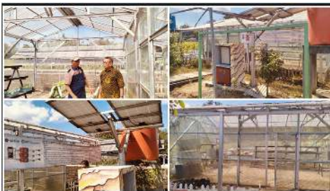
Gambar 1. Lokasi greenhouse dan observasi dari tim pengabdian.

Langkah awal dalam pelaksanaan kegiatan adalah melakukan observasi dan identifikasi kondisi lapangan secara langsung. Tim pengabdian, bersama pengurus Kelompok Sadar Wisata (Pokdarwis) dan Gabungan Kelompok Tani (Gapoktan), melakukan peninjauan ke lokasi yang direncanakan sebagai area pembangunan greenhouse. Lokasi yang ditinjau berada di kawasan yang telah dilengkapi dengan instalasi Pembangkit Listrik Tenaga Surya (PLTS), sehingga sangat mendukung integrasi antara greenhouse dan energi terbarukan. Area ini diharapkan dapat berfungsi sebagai sarana edukasi mengenai pemanfaatan teknologi tepat guna di kawasan wisata Lumbung Mataraman. Adapun lokasi tersebut dipilih berdasarkan beberapa pertimbangan, yaitu: memiliki lahan terbuka yang cukup luas dan mudah diakses; berdekatan dengan fasilitas umum serta memiliki keterbatasan sumber air yang relevan dengan penggunaan PLTS sebagai sumber energi utama; serta memiliki potensi untuk dikembangkan menjadi pusat pembelajaran dan destinasi eduwisata berbasis teknologi tepat guna. Gambar 1, menggambarkan lokasi greenhouse dan PLTS