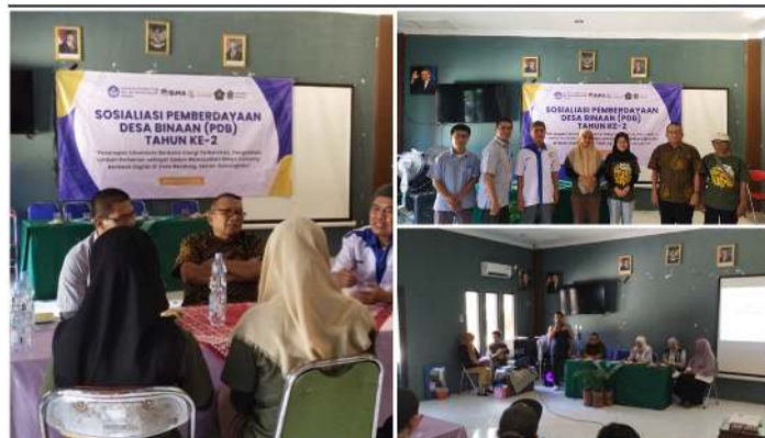
Gambar 3. Suasana diskusi antara tim pelaksana dengan mitra

Materi sosialisasi membahas mengenai prinsip dasar dan manfaat penggunaan greenhouse, khususnya dalam menciptakan iklim mikro buatan yang mendukung pertumbuhan tanaman secara optimal. Selain itu, dijelaskan pula peran penting Pembangkit Listrik Tenaga Surya (PLTS) sebagai sumber energi bersih yang dapat dimanfaatkan untuk mendukung operasional greenhouse secara efisien dan ramah lingkungan. Peserta juga diperkenalkan pada berbagai contoh keberhasilan integrasi greenhouse dengan PLTS di sejumlah daerah sebagai inspirasi implementasi lokal. Materi dilanjutkan dengan pengenalan teknologi Internet of Things (IoT) yang dapat diterapkan dalam sistem pengelolaan greenhouse untuk meningkatkan efisiensi dan kemudahan pemantauan kondisi lingkungan. Sebagai penutup, dipaparkan potensi pengembangan kawasan Lumbung Mataraman sebagai destinasi eduwisata pertanian yang mengintegrasikan aspek edukasi, teknologi, dan pariwisata berbasis pertanian berkelanjutan. Gambar 2, menggambarkan suasana diskusi antara tim pelaksana dengan mitra