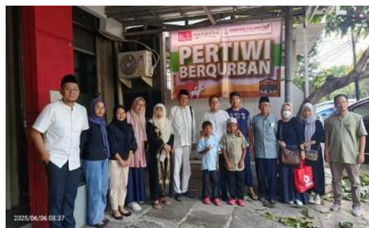
Gambar 1. Lokasi dan Tempat Penyembelihan

Penyiapan lokasi penyembelihan juga telah memenuhi ketentuan dasar kesejahteraan hewan dan prinsip sanitasi lingkungan. Kandang sementara disiapkan dengan pagar kuat dan tempat makan-minum yang memadai. Lokasi penyembelihan dibuat terpisah dari fasilitas umum dan dilengkapi dengan drainase untuk penampungan darah, tempat pengulitan, serta pengolahan limbah.