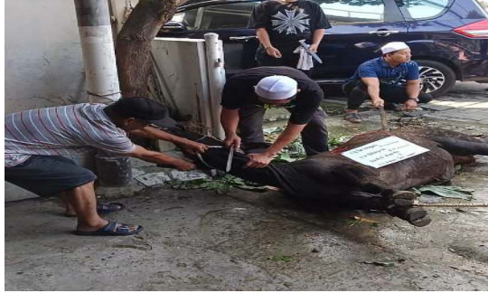
Gambar 2. Penyembelihan Kurban

Setelah penyembelihan, dilakukan pemeriksaan postmortem untuk memastikan hewan benar-benar mati secara sempurna. Petugas tidak langsung menggantung atau memindahkan hewan sebelum memastikan refleksi dan aliran darah berhenti. Setelah hewan dinyatakan mati, proses penggantungan, pengulitan, pengkarkasan, dan pemisahan organ dilakukan secara hati-hati dan sistematis.