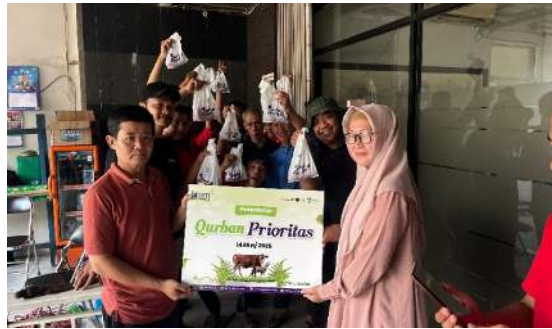
Gambar 3. Pembagian Distribusi Daging Kurban

Penanganan jeroan dan daging dilakukan secara bersih, dengan mencuci organ dalam menggunakan air bersih dan mengelola limbah secara ramah lingkungan. Daging qurban ditimbang dan didistribusikan kepada mustahik dalam waktu maksimal delapan jam setelah proses penyembelihan, sesuai dengan prinsip ketepatan distribusi dan ketahanan mutu daging.