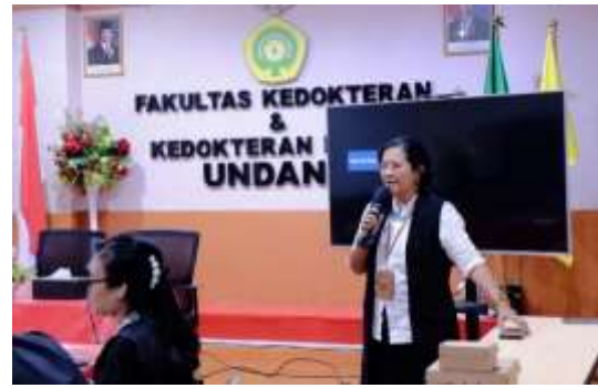
Gambar 1. Suasana Pembukaan Kegiatan PKM Teknik Konseling Bagi Dosen Penasehat Akademik FKKH Universitas Nusa Cendana