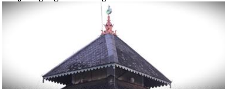
Gambar 3 Gambar Atap Tumpang bagian tiga beserta Mustaka 14 April 2025

Peneliti menganalisis menggunakan teori Roland Bethes bahwa makna denotasi dari atap tumpang bagian ke tiga atau puncak, memiliki penanda struktur berbentuk segitiga sama kaki yang digabungkan sehingga berbentuk krusut dan di atasnya terdapat mustaka sebagai simbolis bangunan masjid. Menurut Soekmono (1995), mustaka dalam arsitektur tradisional Jawa memiliki fungsi sebagai titik akhir struktural, serta berperan dalam memperjelas orientasi bangunan ke arah langit.