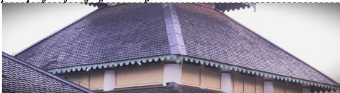
Gambar 2 Atap Tumpang Bagian dua