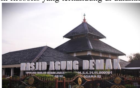
Gambar 1 Masjid Agung Demak

Penelitian ini bertujuan untuk mengungkap makna filosofis yang terkandung dalam struktur atap tumpang Masjid Agung Demak dengan menggunakan pendekatan semiotika Roland Barthes. Melalui metode penelitian kualitatif, data dikumpulkan menggunakan tiga teknik utama, yaitu studi literatur, wawancara mendalam dengan narasumber yang kompeten dalam bidang sejarah dan arsitektur Islam, serta dokumentasi visual asli dari Masjid Agung Demak. Dengan menerapkan teknik analisis simbolik berdasarkan konsep denotasi dan konotasi Barthes, penelitian ini berhasil menunjukkan bahwa atap tumpang Masjid Agung Demak tidak hanya berfungsi sebagai elemen fisik dalam konstruksi bangunan, melainkan juga sebagai simbol yang kaya makna spiritual. Struktur bertingkat ini merepresentasikan nilai-nilai keislaman seperti iman, Islam, dan ihsan, sekaligus menggambarkan perjalanan spiritual manusia dalam budaya keagamaan Nusantara (Sabiq, 2021). Dengan demikian, penelitian ini memperkuat pemahaman bahwa arsitektur tradisional, khususnya pada Masjid Agung Demak, simbolisme religius yang terintegrasi dengan kearifan lokal. Adapun bagian-bagian dari atap tumpang Masjid Agung Demak, mulai dari bagian paling bawah hingga bagian paling atas, akan dijelaskan lebih lanjut untuk memperjelas hierarki filosofis yang terkandung di dalamnya