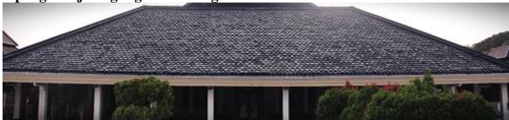
Gambar 2 Atap tumpang bagian satu