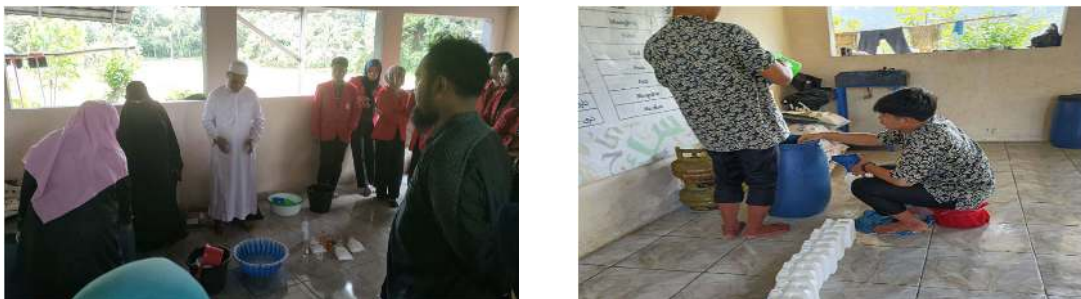
Gambar 2. Pembuatan Pembersih Ramah Lingkungan

Berikut kegiatan saat mengimplementasikan pembuatan pembersih