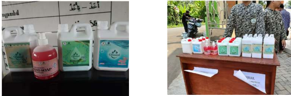
Gambar 3. Kegiatan Packegeing, Label dan Distribusi produk

Tahap kegiatan selanjutnya tahap packegeing dan distribusi produk dengan dilakukannya penjualan secara internal di Pondok Pesantren Daarus Sunnah Rangkasbitung.