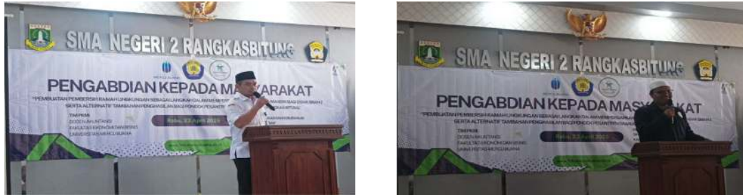
Gambar 1. Koordinasi dan Sosialisasi Kegiatan Pengabdian Masyarakat kepada siswa Pondok Pesantren Daarus Sunnah Rangkas Bitung

Sesuai dengan tahapan yang ditempuh, kegiatan ini diawali dengan koordinasi dengan mitra dan sosialisasi kepada siswa Pondok Pesantren Daarus Sunnah Rangkas Bitung sebagai calon peserta kegiatan sekaligus penyerahan sertifikat kegiatan. Berikut dokumentasinya.