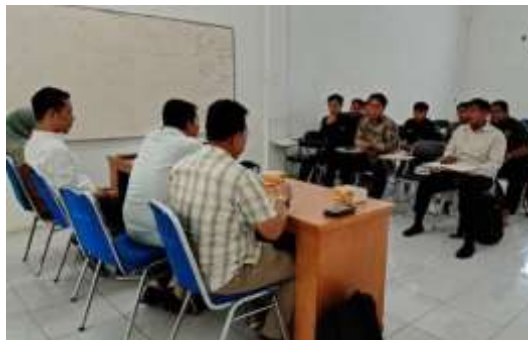
Gambar 1. Persiapan Sosialisasi

Dalam hal ini persiapan dalam melaksanakan pengabdian diawali dengan rapat persiapan pelaksanaan sosialisasi penggunaan website Desa Bandar Pasir Mandoge sebagai sistem administrasi dan media promosi desa.