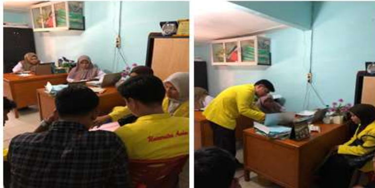
Gambar 3. Penyusunan Materi Sosialisasi