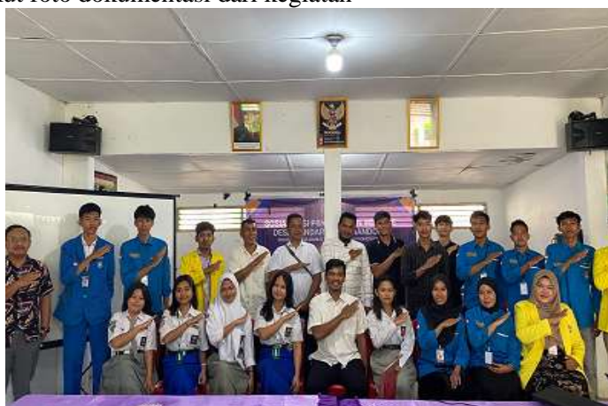
Gambar 4. Tampilan Website Desa Bandar Pasir Mandoge

Dokumentasi ini dibuat sebagai bukti bahwa pelaksanaan kegiatan sosialisasi penggunaan Website Desa Bandar Pasir Mandoge sebagai sistem administrasi dan media promosi telah selesai dilaksanakan. Berikut foto dokumentasi dari kegiatan