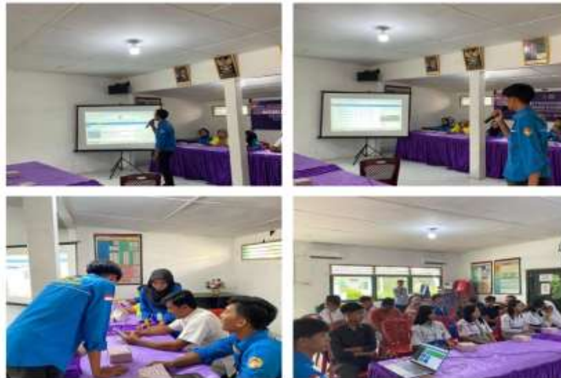
Gambar 2. Penyampaian Media Promosi Desa