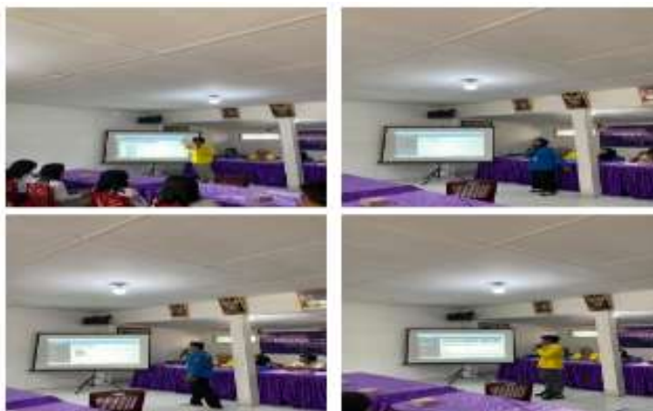
Gambar 3. Penyampaian Sistem Administrasi Desa