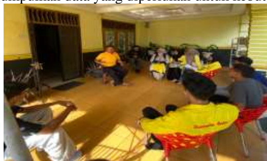
Gambar 2. Koordinasi dengan Kepala Desa

Dalam hal ini kami melakukan koordinasi dengan Kepala Desa Bandar Pasir Mandoge dan Perangkat desa guna mengumpulkan data yang diperlukan untuk kebutuhan website desa.