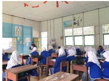
Gambar 2. Kelompok Kontrol