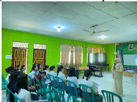
Gambar 1. Kelompok Intervensi