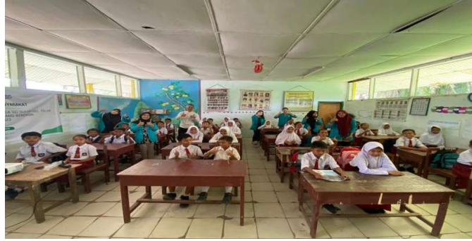
Gambar 1. Pembukaan dan Penyampaian Materi