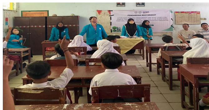
Gambar 3. Penyampaian materi PHBS dan penutupan

Prinsip utama pada tahap pengabdian masyarakat ini adalah meningkatkan pengetahuan, wawasan pemahaman tentang promosi kesehatan dalam hal ini PHBS dan Penggunaan Gadget pada anak-anak: