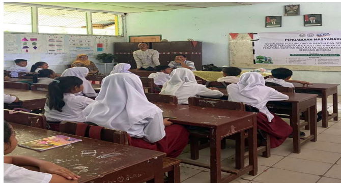
Gambar 2. Penyampaian Materi Tentang Gadget