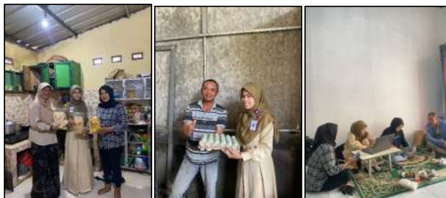
Gambar 4. Proses Pendampingan Pembuatan Sertifikasi Halal dan NIB

Setelah NIB terbit, pelaku usaha akan dibimbing untuk mengurus sertifikasi halal melalui sistem SiHalal. Sebelum mengurus sertifikasi halal informasi terkait bahan merek yang di gunakan dan langkah-langkah pembuatan produknya sudah terkumpul untuk memudahkan proses pembuatan sertifikasi halal selanjutnya, pelaku usaha diminta memasukkan data outlet dan mengisi informasi pengajuan sertifikasi, termasuk data diri. Selain itu, diperlukan surat pernyataan dari pelaku usaha yang menyatakan bahwa bahan yang digunakan dalam proses produksi adalah halal. Proses pengurusan sertifikat halal biasanya memerlukan waktu yang cukup panjang, kurang lebih satu bulan, sebelum sertifikat resmi diterbitkan.