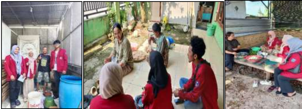
Gambar 2. Survey Lapangan Ke Pelaku UMKM di Kelurahan Bendung