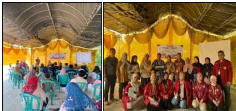
Gambar 3. Pelaksanaan Sosialisasi Sertifikasi Halal dan NIB