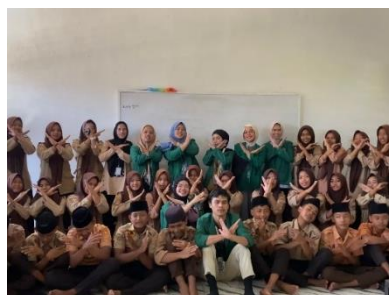
Gambar 3. Menyuarakan Pencegahan Pelecehan Seksual dan Foto Bersama

Berdasarkan keseluruhan, kegiatan sosialisasi mengenai pencegahan tindakan pelecehan seksual pada lingkungan Madrasah di Desa Durian ini menunjukkan perkembangan positif. Dimulai dari tahapan pengenalan, penyampaian materi, tanya jawab, hingga evaluasi, telah terbukti mampu meningkatkan pemahaman siswa tentang pelecehan seksual sekaligus menumbuhkan keberanian mereka dalam berdiskusi. Antusiasme siswa dalam mengikuti kegiatan sampai selesai, menjadi bukti bahwa metode sosialisasi ini efektif. Kegiatan ini tidak hanya menambah pengetahuan, tetapi juga membentuk kesadaran siswa tentang pentingnya pencegahan pelecehan seksual di lingkungan sekolah, sehingga dapat menjadi langkah awal untuk menciptakan ruang belajar yang aman dan nyaman bagi semua orang.