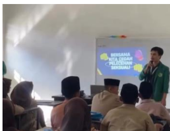
Gambar 1. Perkenalan dengan siswa Mts Darussalam Desa Durian

Kegiatan dimulai dengan sesi perkenalan untuk menciptakan suasana nyaman dan mengurangi rasa canggung di antara siswa. Sesuai dengan metode pendekatan partisipatif yang kami gunakan, siswa diberitahukan mengenai tujuan kegiatan dan diberikan kesempatan mengenal mahasiswa, sehingga dapat meningkatkan kenyamanan dan kesiapan mereka untuk berpartisipasi aktif. Ice breaking berupa permainan ringan yang diberikan berhasil mencairkan suasana dan membuat siswa lebih fokus. Suasana kelas yang semula tenang berubah menjadi lebih aktif karena siswa tampak terlibat dan antusias mengikuti instruksi. Respon positif dari siswa menunjukkan bahwa tahap awal ini efektif mempersiapkan mereka untuk menerima materi.