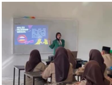
Gambar 2. Penyampaian Materi Pencegahan Pelecehan Seksual

Kegiatan sosialisasi dilanjutkan dengan penyampaian materi yang disampaikan oleh mahasiswa. Materi mencakup definisi, bentuk, dampak, cara mencegah dan menangani pelecehan seksual. Materi disampaikan dengan cara sederhana dengan bantuan media visual seperti slide presentasi, serta didukung dengan penguraian alat pengeras suara ( sound system ) sehingga penjelasan dapat tersampaikan dengan jelas. Siswa diberikan contoh sebab akibat dari tindakan pelecehan seksual untuk memberikan pemahaman yang lebih jelas mengenai bahaya dan dampak negatifnya. Selama penyampaian materi, siswa terlihat menyimak materi dengan serius. Hal ini mulai menunjukkan ketertarikan siswa dengan isu pelecehan seksual dan mereka mulai memahami pentingnya pengetahuan mengenai pelecehan seksual. Sesi ini juga menyertakan sesi tanya jawab yang memungkinkan siswa untuk mengajukan pertanyaan dan berbagi pandangan, sehingga memperdalam pemahaman mereka tentang materi yang disampaikan.