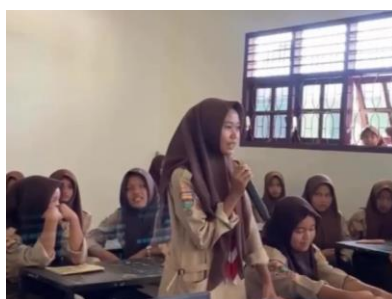
Gambar 3. Melakukan Evaluasi Dengan Menjawab Pertanyaan

Sesi tanya jawab dibuka setelah penyampaian materi selesai. Pada awalnya, siswa terlihat ragu untuk mengangkat tangan, sehingga perlu diberi dorongan untuk memberanikan diri. Beberapa siswa mulai berani mengangkat tangan dan menyampaikan pertanyaan maupun memberikan pendapat mereka mengenai materi pelecehan seksual. Tercatat sekitar tujuh orang siswa mengangkat tangan untuk bertanya secara langsung dari tempat duduk. Pertanyaan yang diberikan cukup beragam, dimulai dari rasa ingin tahu tentang bagaimana cara melaporkan kasus jika menimpa orang terdekat sampai hukum yang diterima oleh pelaku pelecehan seksual. Mahasiswa menjelaskan bahwa siswa dapat segera melapor kepada guru, wali kelas, atau pihak sekolah yang dipercaya supaya penanganan dapat dilakukan lebih cepat. Mahasiswa juga menekankan bahwa korban tidak boleh dipersalahkan atas kejadian yang tidak dia inginkan sama sekali. Jawaban mengenai hukum yang didapatkan pelaku pelecehan seksual diambil berdasarkan UU No. 12 Tahun 2022, bahwasannya pelaku dapat dikenai pidana penjara minimal 2 tahun hingga maksimal 12 tahun serta denda sesuai ketentuan. Siswa terlihat puas dengan penjelasan yang diberikan.