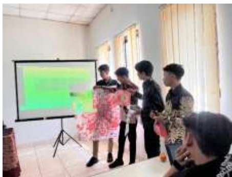
Gambar 4. Pemaparan Proses Kain Jumputan dengan Teknik Tie Dye

Peserta seminar menunjukkan respons positif terhadap sesi ini. Banyak yang menyampaikan ketertarikan untuk membuat produk serupa sebagai usaha rumahan, baik untuk dijual langsung maupun dijadikan souvenir khas lokal.