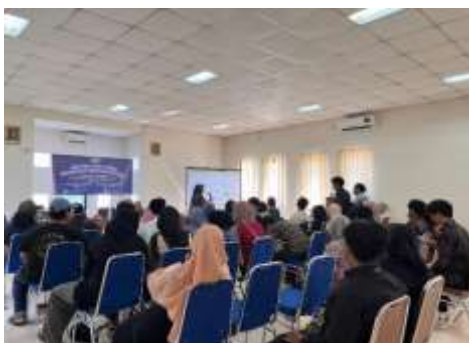
Gambar 2. Pemaparan Materi “Pemasaran Digital UMKM”

Peserta seminar sangat antusias. Banyak dari mereka mencatat dan berdiskusi mengenai kendala teknis seperti tidak memiliki kamera yang bagus atau tidak paham cara mengedit. Namun Ibu Dewi menekankan bahwa konsistensi dan kemauan belajar jauh lebih penting daripada alat yang canggih. Materi ini sangat membuka wawasan peserta bahwa UMKM tidak harus tertinggal dalam arus digitalisasi dan bahwa siapa pun bisa memasarkan produknya secara daring dengan pendekatan yang tepat.