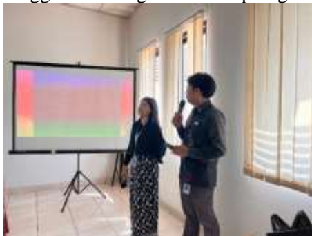
Gambar 3. Pemaparan Proses Lilin Aromaterapi dari Minyak Jelantah

Selama demonstrasi berlangsung, peserta tampak sangat antusias. Banyak di antaranya mencatat langkah-langkah secara detail, mengambil dokumentasi, dan aktif mengajukan pertanyaan seputar bahan