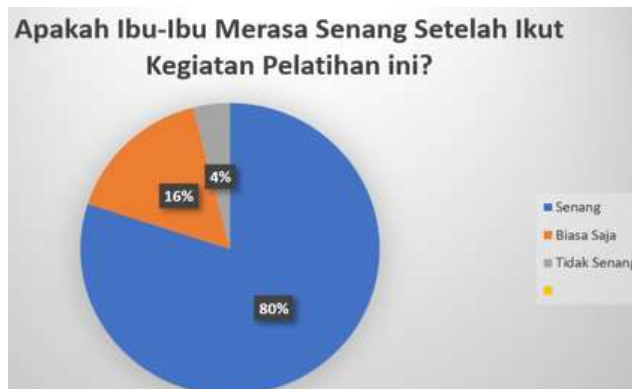
Gambar 4. Kepuasan Peserta

Berdasarkan gambar 4 diatas untuk pertanyaan "Apakah ibu-ibu merasa senang setelah ikut kegiatan pelatihan ini?" dari 25 peserta sebanyak 80% menjawab "SENANG", sebanyak 16% menjawab "BIASA SAJA" dan sebanyak 4% menjawab "TIDAK SENANG". Hal ini dapat disimpulkan bahwa ibu-ibu peserta senang mengikuti kegiatan ini.