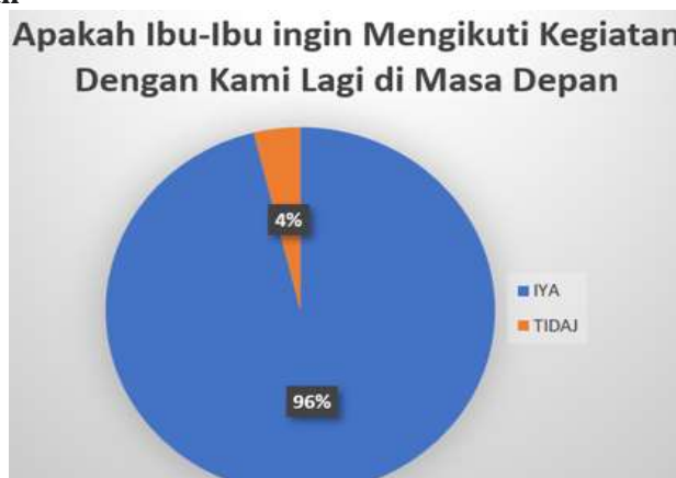
Gambar 5. Keberlanjutan Kegiatan

Berdasarkan gambar 5 diatas untuk pertanyaan "Apakah ibu-ibu ingin mengikuti kegiatan dengan kami lagi di masa depan?" dari 25 peserta sebanyak 96% menjawab "IYA" dan 4% menjawab "TIDAK". Hal ini dapat disimpulkan bahwa ibu-ibu peserta ingin mengikuti kegiatan ini di masa mendatang dengan catatan diberikan pelatihan lainnya lagi.