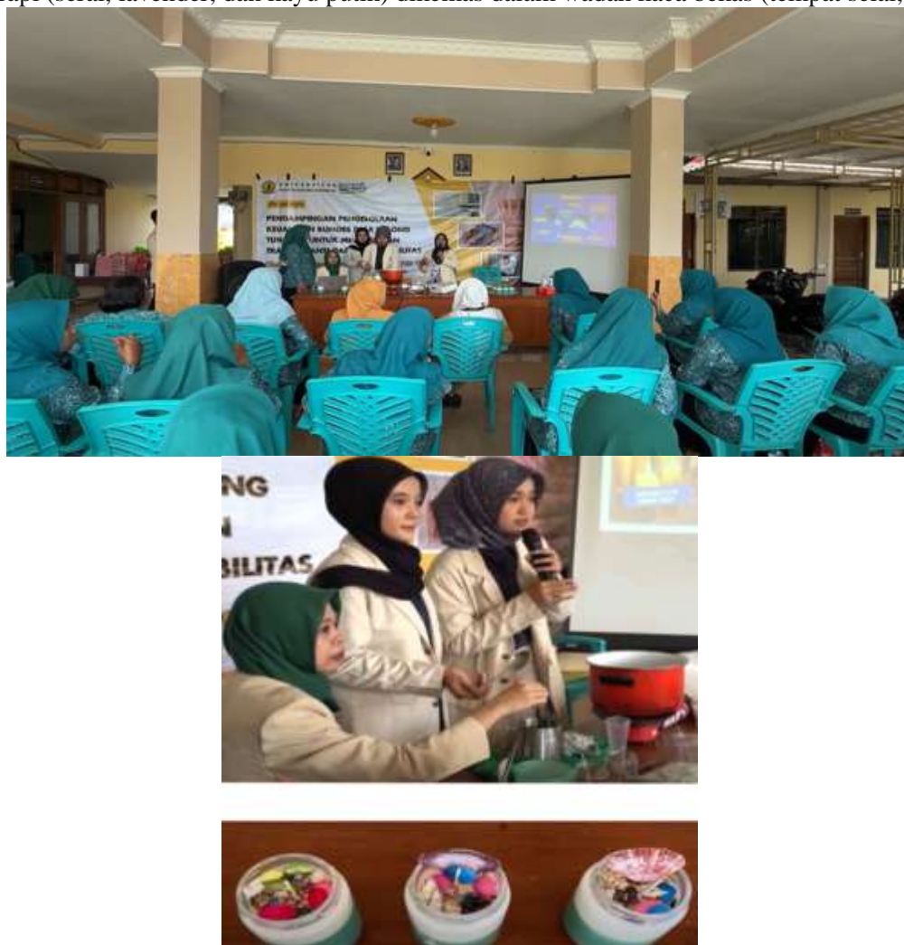
Gambar 2. Kegiatan Pelatihan Pembuatan Aroma Terapi

dengan metode demonstrasi langsung dan praktik kelompok kecil. Produk akhir berupa 3 varian aromaterapi (serai, lavender, dan kayu putih) dikemas dalam wadah kaca bekas (tempat selai, gelas).