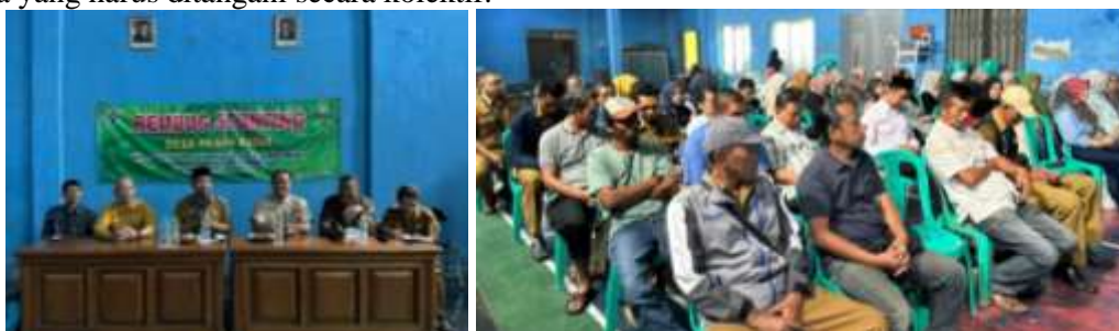
Gambar 2. Rembug Stunting

Dari segi materi, seminar menyentuh berbagai aspek yang relevan, mulai dari pengertian stunting, faktor penyebab, dampak jangka panjang, hingga langkah-langkah praktis dalam pemenuhan gizi seimbang. Penyampaian yang dilengkapi dengan media visual seperti poster dan slide presentasi membuat informasi lebih mudah dipahami, bahkan oleh peserta dengan latar belakang pendidikan yang beragam. Kehadiran tenaga kesehatan dari Puskesmas dan dukungan pemerintah desa semakin memperkuat kredibilitas seminar, sekaligus menegaskan bahwa isu stunting merupakan prioritas bersama yang harus ditangani secara kolektif.