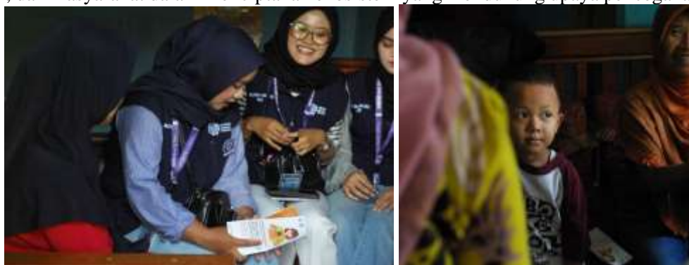
Gambar 3. Home Visit Stunting

Dari sisi dampak, kombinasi seminar dan tindak lanjut melalui home visit menunjukkan hasil yang menjanjikan. Masyarakat menjadi lebih terbuka terhadap informasi gizi, orang tua lebih termotivasi untuk memperbaiki pola makan anak, dan kader Posyandu semakin berperan aktif dalam pemantauan pertumbuhan. Di sisi lain, kegiatan ini juga memperkuat kolaborasi antara pemerintah desa, tenaga kesehatan, dan masyarakat dalam menciptakan ekosistem yang mendukung upaya pencegahan stunting.