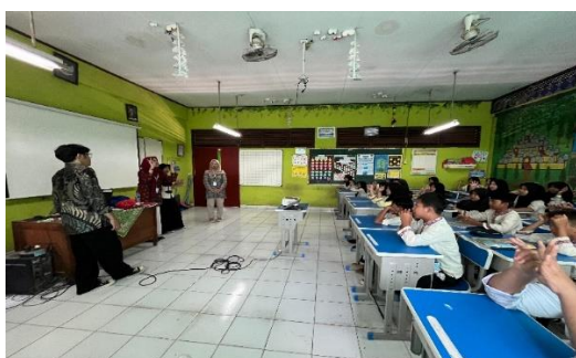
Gambar 3. Sosialisasi Kegiatan Membangun Karakter Anti-Bullying