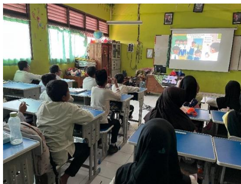
Gambar 2. Kegiatan Menonton Ilustrasi Membangun Karakter Anti-Bullying