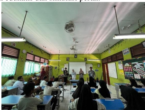
Gambar 1. Kegiatan Membangun Karakter Anti-Bullying

Jumlah siswa yang terlibat adalah 72 orang (kelas 3–5), dengan 12 guru serta perwakilan orang tua sebanyak 25 orang. Tingkat partisipasi cukup tinggi, ditandai dengan antusiasme siswa dalam mengikuti kegiatan permainan edukatif dan simulasi peran.