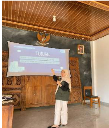
Gambar 1. Pemaparan Materi