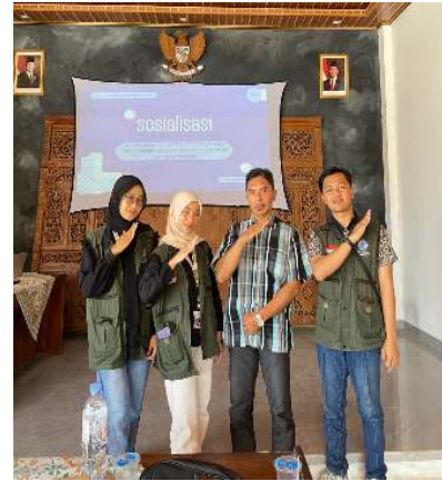
Gambar 2. Foto Bersama