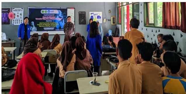
Gambar 2. Pengisian Angket

Dari hasil pengisian angket diperoleh persentase hasil jawaban peserta dapat dilihat pada Gambar 3.