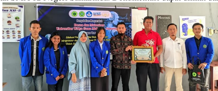
Gambar 1. Serah Terima Cenderamata