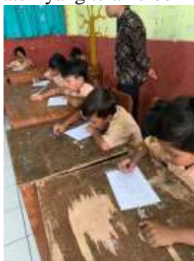
Gambar 3. Pengisian Post-Test

Pada tahap kelima, Pada tahap kelima, siswa diberikan kembali lembar post-test sebagai instrumen evaluasi. Tujuannya adalah untuk mengetahui sejauh mana pemahaman dan pengetahuan siswa mengalami peningkatan setelah mendapatkan edukasi tentang bullying . Melalui hasil post-test ini, fasilitator dapat membandingkan kemampuan siswa sebelum dan sesudah kegiatan, sehingga terlihat secara nyata efektivitas penyampaian materi yang telah diberikan.