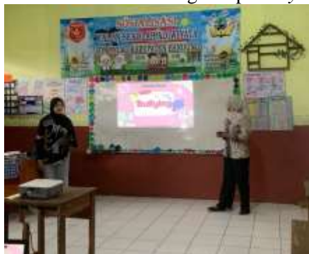
Gambar 1. Pemaparan Materi

Pada tahap ketiga, fasilitator memberikan pelatihan tentang melawan bullying . Pelatihan yang dilaksanakan berupa psikoedukasi melawan bullying pada siswa SDN Pelag Nagrak. Adapun materi berisi tentang pelatihan melawan bullying , tentang hal apa saja yang harus dilakukan ketika menjadi korban bullying dan bagaimana cara melawan dan menghadapi bullying .