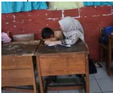
Gambar 2. Refleksi Diri

Melalui kegiatan refleksi tersebut, siswa diberi kesempatan untuk menuliskan cerita atau pengalaman mereka secara singkat di selembar kertas. Cara ini dipilih agar setiap anak merasa lebih nyaman untuk berbagi, karena tulisan tersebut menjadi sarana yang aman tanpa harus mengungkapkannya secara langsung di depan teman-teman lain. Dengan demikian, siswa dapat mengekspresikan perasaan dan pengalaman mereka tanpa rasa malu ataupun takut dinilai.