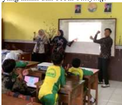
Gambar 4. Menyanyikan Lagu Bersama

Kegiatan selanjutnya ditutup dengan menyanyikan dengan bertema lagu anti bullying bersama-sama, sebagai bentuk penguatan pesan moral sekaligus membangun komitmen kolektif untuk menciptakan lingkungan sekolah yang aman dan bebas bullying .