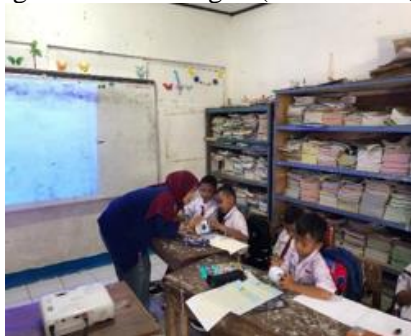
Gambar 2. Menjelaskan materi dan membagikan celengan kepada kelas II

Seorang pendidik tidak semata – mata berperan sebagai penyampai materi, melainkan juga memiliki peran lain yang penting. seorang guru juga memiliki tanggung jawab untuk membimbing dan memelihara agar karakter baik dapat tumbuh dalam diri seorang siswa, serta mendorong mereka untuk mewujudkan dalam kehidupan sehari – hari (Fatmah, 2018). Materi pertama dalam sosialisasi menjelaskan bahwa menabung adalah kegiatan menyisihkan uang untuk masa depan, yang secara tidak langsung melatih siswa mengelola keuangan (Dewi et al., 2024). Program Gemar Menabung telah terbukti efektif dalam membentuk sikap hemat pada siswa kelas II Sekolah Dasar. Gemar Menabung sejalan dengan teori Pendidikan mengajarkan anak – anak tentang menabung dan mengelola uang sejak dini. Dengan mengajarkan siswa tentang menabung dan mengelola uang, program Gemar Menabung dapat membantu siswa megembangkan sikap hemat dan kemampuan keuangan yang baik. Oleh karena itu, kegiatan ini bertujuan untuk memberikan sosialisasi kepda anak – anak usia dini mengenai pentingnya menyimpan uang sebagai bentuk tabungan (Samin et al., 2023).