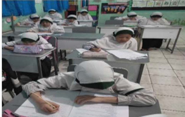
Gambar 1. Peserta Didik Membaca, Menyimak dan Mengerjakan Tugas

IV sangat bagus dalam membaca sudah lancar dan tidak mengeja, serta tulisannya bagus dan rapi bisa dibaca.