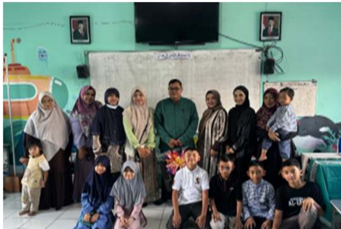
Gambar 2. Guru Kelas, Orangtua dan Peserta Didik Sangat Aktif dan Antusias

Peserta didik dan orangtuanya sangat semangat dalam melaksanakan kegiatan literasi, karena mudah paham penjelasan yang dimaksud dan arahan untuk membaca dan menulis. Peserta didik dan orangtuanya juga sangat antusias, aktif dalam hal bertanya dan menjawab.