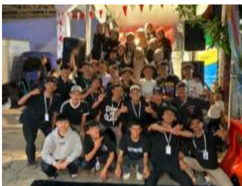
Gambar 1. Memperingati Hari Ulang Tahun ke-80 Republik bersama RW 01