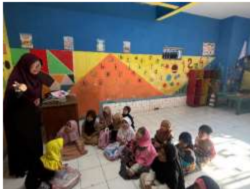
Gambar 7. Mengajar ngaji di Madrasah At-Tauhid RW 4

Melalui kegiatan mengajar ngaji di Madrasah At-Tauhid RW 4. Kegiatan ini dilaksanakan setiap sore hari dengan sasaran utama anak-anak tingkat TK hingga SD. Mahasiswa KKN berperan aktif dalam membimbing anak-anak membaca dan melafalkan huruf hijaiyah, memperbaiki tajwid, serta mengajarkan doa-doa harian. Tidak hanya sekedar mengajar, tetapi kegiatan ini juga menjadi sarana untuk menanamkan nilai-nilai akhlak, kedisiplinan, dan kecintaan terhadap Al-Qur'an sejak usia dini. Antusiasme anak-anak dalam mengikuti pembelajaran menjadi motivasi tersendiri bagi mahasiswa untuk terus memberikan kontribusi terbaik. Kegiatan ini juga mendapat dukungan penuh dari pengurus madrasah dan masyarakat sekitar, sehingga tercipta suasana pembelajaran yang menyenangkan, hangat, dan penuh makna.