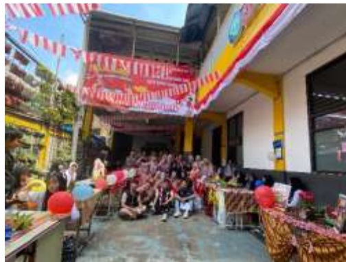
Gambar 5. Memperingati Hari Ulang Tahun ke-80 Republik Indonesia bersama SMP Pasundan 9 Bandung

Dalam rangka memperingati Hari Ulang Tahun ke-80 Republik Indonesia, Kelompok KKN 2 Sukahaji bersama SMP Pasundan 9 Bandung sukses menyelenggarakan Karnaval dan Tumpeng Fest dalam peringatan HUT RI ke-80 pada 17 Agustus. Acara diawali dengan yel-yel antar kelas, karnaval dan diakhiri dengan tumpeng fest yang melibatkan seluruh pelajar dan guru. Kegiatan ini menjadi wujud kebersamaan, gotong royong, dan semangat nasionalisme antara mahasiswa dan Lembaga pendidikan. Kolaborasi ini tidak hanya memeriahkan peringatan kemerdekaan, tetapi juga mempererat tali silaturahmi dan menumbuhkan rasa cinta tanah air.