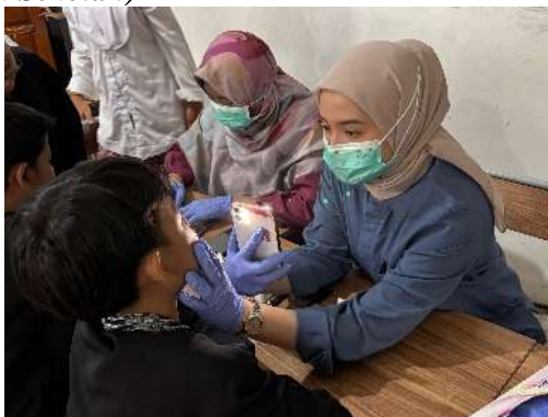
Gambar 14. Program BIAS (Bulan Imunisasi Anak Sekolah) di SDN 144 Situgunting