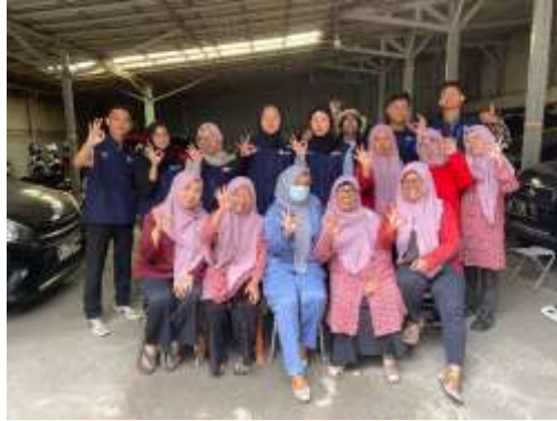
Gambar 6. kegiatan layanan posyandu di wilayah kelurahan

Sebagai bentuk pengabdian kepada masyarakat, KKN 2 Sukahaji turut serta dalam kegiatan layanan posyandu di wilayah desa. Mahasiswa tidak hanya hadir sebagai pendamping, tetapi juga terjun langsung dalam membantu dan bertukar peran sementara dengan petugas posyandu. Hal ini memberikan pengalaman nyata dalam pelayanan kesehatan masyarakat, khususnya terkait gizi balita, kesehatan ibu, serta pemantauan tumbuh kembang anak.