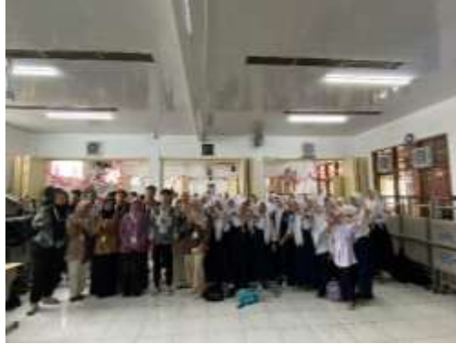
Gambar 10. Edukasi Compass Chain bersama siswa SMP Pasundan 9 Bandung kelas 9