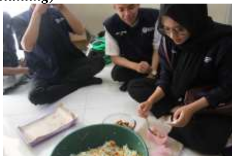
Gambar 12. Program DASHAT (Dapur Sehat Atasi Stunting)