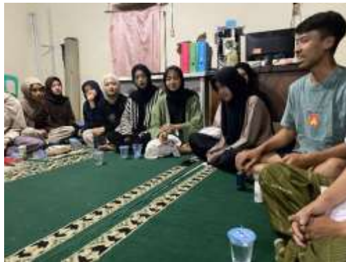
Gambar 11. Edukasi Compass Chain bersama Karang Taruna RW 01

Compass Chain merupakan sebuah komunitas yang dibentuk oleh mahasiswa KKN 2 Sukahaji sebagai respon terhadap berbagai problematika sosial yang terjadi di Kelurahan Sukahaji. Keresahan yang muncul dari isu pernikahan dini, putus sekolah, dan kenakalan remaja mendorong mahasiswa untuk menghadirkan sebuah wadah yang mampu menjadi sarana pembinaan sekaligus pendampingan bagi generasi muda. Komunitas ini melibatkan siswa SMP 9 Pasundan Bandung serta pemuda Karang Taruna Kelurahan Sukahaji sebagai anggota utama. Melalui Compass Chain, mahasiswa KKN berupaya menghadirkan ruang positif bagi remaja untuk mengekspresikan diri, berdiskusi, serta memperoleh bimbingan mengenai pentingnya pendidikan, perencanaan masa depan, dan pembentukan karakter yang lebih baik.