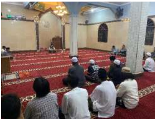
Gambar 8. Tahlilan dan pengajian mingguan bersama warga RW 05

Tahlilan dan pengajian mingguan yang diselenggarakan setiap Kamis malam bersama warga RW 05. Kegiatan ini menjadi sarana mempererat silaturahmi antara mahasiswa dengan masyarakat melalui suasana kebersamaan yang penuh khidmat. Pengajian dan tahlilan dilaksanakan sebagai bentuk doa bersama untuk para leluhur serta memohon keberkahan bagi warga. Setelah itu, kegiatan dilanjutkan dengan pengajian yang diisi dengan pembacaan ayat suci Al-Qur'an dan tausiyah keagamaan. Keterlibatan mahasiswa dalam kegiatan ini bukan hanya sekadar hadir, tetapi juga ikut serta dalam prosesi ibadah, mendengarkan kajian, serta berbaur dengan masyarakat sekitar. Hal ini menjadi pengalaman spiritual berharga yang menambah kedekatan emosional antara mahasiswa dan warga.