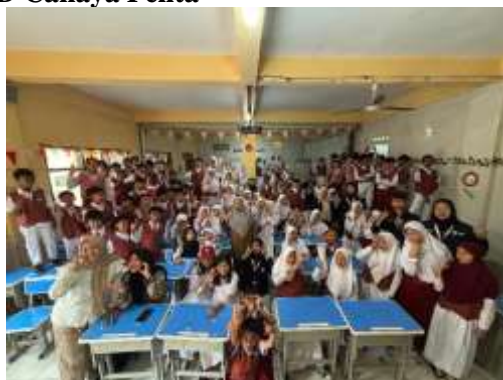
Gambar 16. Kegiatan Edutalk (Education and Talk) di SD Cahaya Pelita

SDN 144 Situgunting yang bertempat di RW 01 dan SD Cahaya Pelita di RW 02. Mahasiswa KKN 2 Sukahaji menyelenggarakan kegiatan Edutalk ( Education and Talk ) yang ditujukan bagi para pelajar. Kegiatan ini bertujuan memberikan pengetahuan serta wawasan mengenai isu-isu penting yang sering dihadapi remaja, khususnya terkait anemia dan gizi serta bullying .