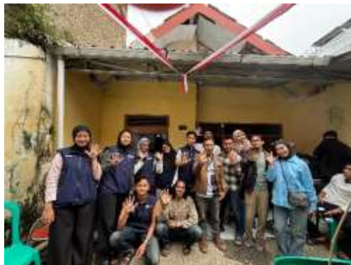
Gambar 15. Cek Kesehatan Gratis di RW 05

Kegiatan Cek Kesehatan Gratis dilaksanakan di RW 05 dengan berkolaborasi antara mahasiswa KKN 2 Sukahaji dan Puskesmas Kelurahan Sukahaji. Program ini bertujuan memberikan layanan kesehatan dasar kepada masyarakat, seperti pengecekan tekanan darah, gula darah, serta konsultasi kesehatan. Mahasiswa KKN berperan aktif dalam membantu teknis pelaksanaan, pendataan peserta, serta pendampingan masyarakat selama pemeriksaan. Antusiasme warga RW 05 sangat tinggi, terlihat dari banyaknya masyarakat yang hadir dan memanfaatkan layanan kesehatan ini.