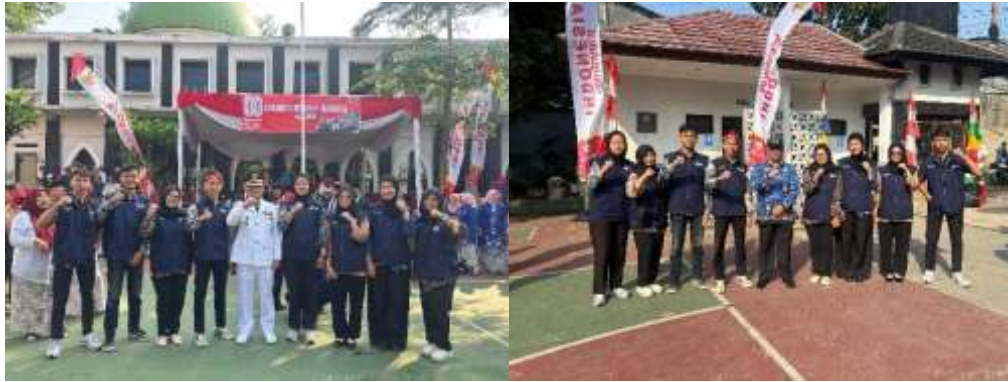
Gambar 4. Upacara Bendera 17 Agustus

Dalam rangka memperingati Hari Ulang Tahun ke-80 Republik Indonesia, kelompok KKN 2 Sukahaji berpartisipasi pada acara Kecamatan dalam melaksanakan Upacara Bendera 17 Agustus sebagai puncak peringatan kemerdekaan. Kegiatan upacara berlangsung dengan khidmat, dihadiri oleh perangkat desa, tokoh masyarakat, warga RW 01, serta mahasiswa KKN. Rangkaian acara dimulai dengan pengibaran Bendera Merah Putih, pembacaan teks Proklamasi, mengheningkan cipta, hingga doa bersama sebagai bentuk penghormatan kepada jasa para pahlawan bangsa.