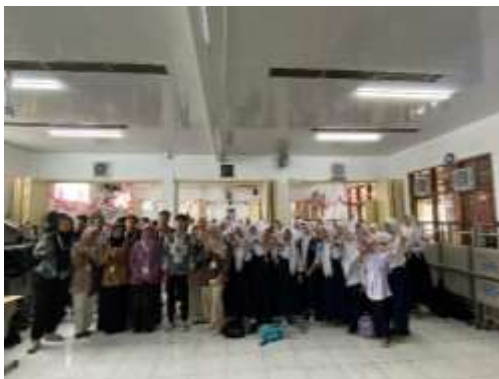
Gambar 17. Kegiatan Edutalk (Education and Talk) di SMP Pasundan 9 Bandung

Mahasiswa KKN 2 Sukahaji menyelenggarakan kegiatan Edutalk ( Education and Talk ) bagi para pelajar sebagai sarana berbagi pengetahuan dan wawasan mengenai isu-isu penting remaja. Materi yang diberikan meliputi anemia dan gizi, bullying , sexual harassment , penataan masa depan, serta kenakalan remaja. Melalui kegiatan ini, mahasiswa tidak hanya menyampaikan materi, tetapi juga mengajak pelajar berdiskusi secara interaktif sehingga tercipta suasana belajar yang menyenangkan. Harapannya, kegiatan ini dapat menumbuhkan kesadaran pelajar untuk lebih peduli pada kesehatan, berani melawan perundungan, menjaga diri dari tindakan yang merugikan, serta mampu menata masa depan dengan langkah yang positif.