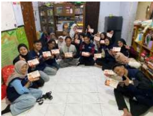
Gambar 13. Berbagi Jumat Berkah berkolaborasi dengan Almaz Bandung

Salah satu agenda sosial yang dijalankan oleh KKN 2 Sukahaji adalah kegiatan Berbagi Jumat Berkah yang berkolaborasi dengan Almaz Bandung. Program ini dilaksanakan sebagai wujud kepedulian terhadap sesama serta upaya menumbuhkan semangat berbagi kepada masyarakat yang membutuhkan.