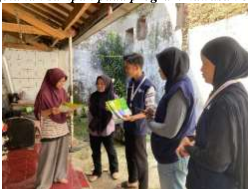
Gambar 9. program kawasan bebas sampah

Dalam rangka mendukung terciptanya lingkungan yang sehat dan berkelanjutan, KKN 2 Sukahaji berkolaborasi dengan Dinas Lingkungan Hidup dalam kegiatan edukasi pemilahan dan pengolahan sampah. Program ini dilaksanakan di RW 02 dengan mengusung konsep KBS (Kawasan Bebas Sampah). Kegiatan ini bertujuan untuk meningkatkan kesadaran masyarakat mengenai pentingnya pengelolaan sampah sejak dari rumah tangga. Mahasiswa bersama pihak Dinas Lingkungan Hidup memberikan sosialisasi mengenai cara memilah sampah organik dan anorganik, pemanfaatan kembali sampah yang masih bernilai guna, hingga pengolahan sederhana sampah organik menjadi kompos.