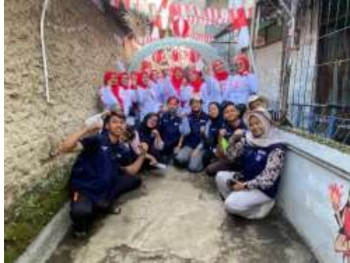
Gambar 2. Memperingati Hari Ulang Tahun ke-80 Republik bersama RW 01

Dalam rangka memperingati Hari Ulang Tahun ke-80 Republik Indonesia, Kelompok KKN 2 Sukahaji bersama RW 02 sukses menyelenggarakan kemeriahan peringatan HUT RI ke-80 pada 17 Agustus. Acara diawali dengan senam, perlombaan dan diakhiri dangdutan yang melibatkan seluruh warga, dari anak-anak hingga orang tua. Kegiatan ini menjadi wujud kebersamaan, gotong royong, dan semangat nasionalisme antara mahasiswa dan masyarakat. Kolaborasi ini tidak hanya memeriahkan peringatan kemerdekaan, tetapi juga mempererat tali silaturahmi dan menumbuhkan rasa cinta tanah air.