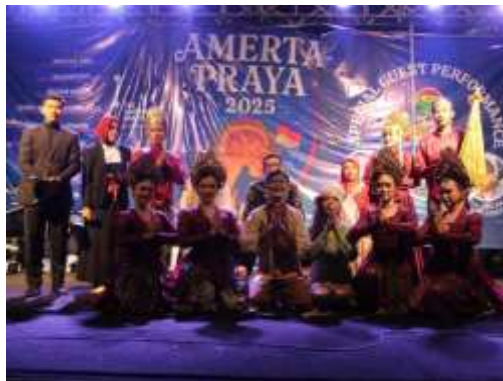
Gambar 3. memperingati Hari Ulang Tahun ke-80 Republik Indonesia bersama RW 05

Dalam rangka memperingati Hari Ulang Tahun ke-80 Republik Indonesia, Kelompok KKN 2 Sukahaji bersama RW 05 sukses menyelenggarakan malam puncak peringatan HUT RI ke-80 pada 17 Agustus. Acara diawali dengan Tarian lengser dan diakhiri penampilan 3 Bintang tamu Preman Pensiun yang melibatkan seluruh warga, dari anak-anak hingga orang tua. Kegiatan ini menjadi wujud kebersamaan, gotong royong, dan semangat nasionalisme antara mahasiswa dan masyarakat. Kolaborasi ini tidak hanya memeriahkan peringatan kemerdekaan, tetapi juga mempererat tali silaturahmi dan menumbuhkan rasa cinta tanah air.