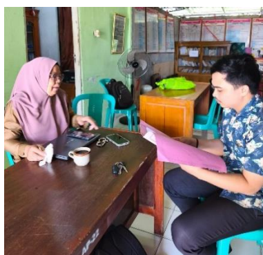
Gambar 1. Wawancara pada Masyarakat

Diskusi dan tanya jawab juga menjadi bagian penting dalam kegiatan. Banyak masyarakat yang mengungkapkan rasa ingin tahu terkait perbedaan antara biaya pemeliharaan (ujrah) dengan bunga. Melalui penjelasan sederhana, masyarakat dapat memahami bahwa ujarah hanya biaya riil untuk pemeliharaan barang jaminan, bukan keuntungan yang bersifat riba 2 .