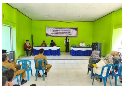
Gambar 2. Penyampaian Materi dari Pengadain Syariah