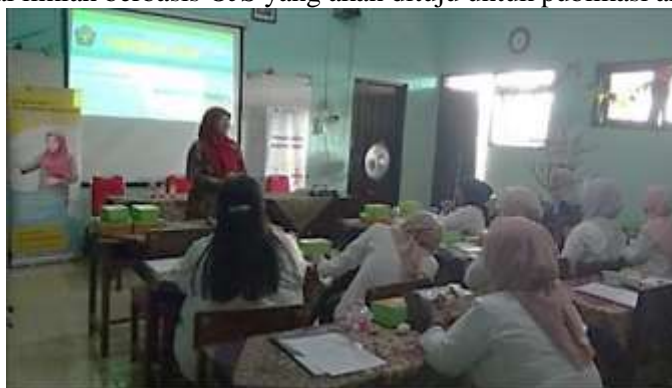
Gambar 1. Dokumentasi Kegiatan Pelatihan

Pelaksanaan kegiatan inti PKM pada sesi pertama pelatihan meliputi kegiatan pemaparan materi terkait pengertian OJS, keuntungan penggunaan OJS, cara memilih jurnal nasional yang sesuai dengan bidang studi artikel ilmiah yang telah disusun guru, dan cara membuat akun pada jurnal ilmiah yang telah dipilih. Pada sesi pertama ini peserta pelatihan diberikan pemahaman terkait OJS dan cara pembuatan akun pada jurnal yang akan dituju. Hasil pelatihan sesi pertama ini, peserta pelatihan telah memiliki akun di jurnal ilmiah berbasis OJS yang akan dituju untuk publikasi artikel ilmiah.