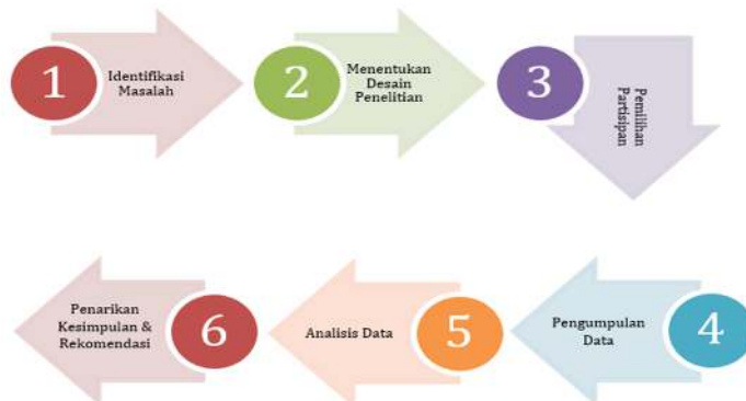
Gambar 1. Langkah-langkah dalam penelitian

(menyusun data dalam bentuk narasi dan tabel), dan 3) penarikan kesimpulan secara induktif berdasarkan temuan. Sedangkan keabsahan data diuji dengan; 1) triangulasi sumber, 2) triangulasi teknik (observasi, wawancara, dan dokumentasi), dan 3) member cek untuk memastikan temuan di lapangan telah sesuai dengan interpretasi peneliti. Berikut ini merupakan visualisasi langkah-langkah dalam penelitian ini.