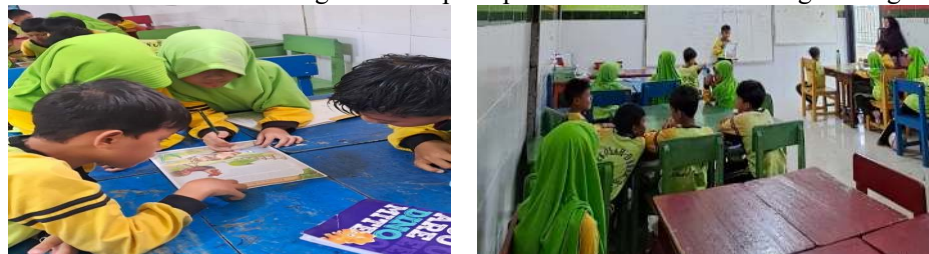
Gambar 2. Aktifitas siswa di dalam kelas (2 foto)

Berdasarkan hasil wawancara terhadap siswa, sebagian besar siswa merasa pembelajaran lebih mudah untuk dipahami dan terasa menyenangkan. Siswa merasa terbantu karena materi yang diberikan kepada mereka telah disesuaikan dengan kemampuan pemahaman mereka masing-masing.