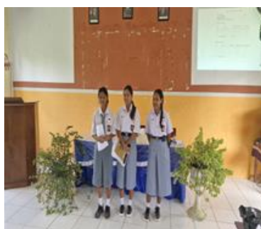
Gambar 4. Presentasi dan Refleksi Hasil