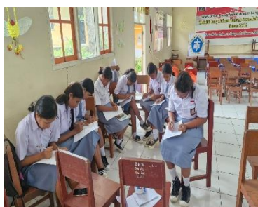
Gambar 5. Post-Test dan Evaluasi

Pelaksanaan kegiatan dilakukan selama satu hari penuh, dimulai dengan pembukaan dan pre-test untuk mengukur pemahaman awal siswa. Materi disampaikan secara interaktif oleh tim, mencakup pentingnya pengelolaan keuangan OSIS, konsep transparansi dan akuntabilitas, serta peran partisipasi dalam pengambilan keputusan anggaran. Selanjutnya, siswa melakukan simulasi penyusunan RAK dan laporan pertanggungjawaban keuangan secara berkelompok. Setiap kelompok mempresentasikan hasilnya, yang kemudian ditanggapi oleh tim dengan masukan konstruktif. Kegiatan ditutup dengan post-test dan evaluasi melalui observasi, umpan balik siswa, serta diskusi dengan guru pendamping.