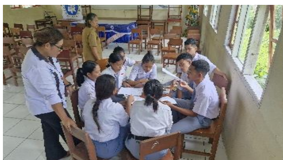
Gambar 3. Simulasi Perencanaan dan Pelaporan Keuangan