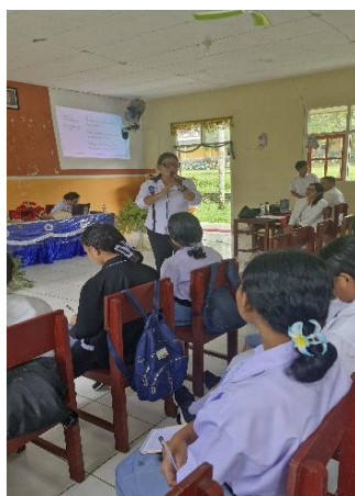
Gambar 2. Penyampaian Materi Interaktif