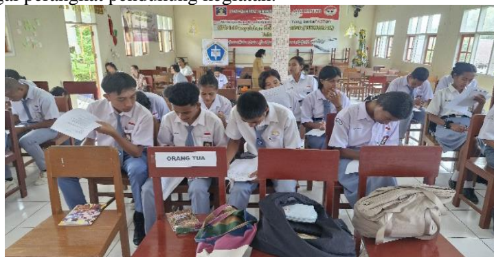
Gambar 1. Pre-Test

Metode pelaksanaan kegiatan ini dilakukan secara partisipatif dengan pendekatan edukatif interaktif serta praktik langsung melalui simulasi perencanaan dan pelaporan keuangan. Tahap awal dimulai dengan koordinasi bersama pihak sekolah, termasuk kepala sekolah, guru pendamping OSIS, dan perwakilan OSIS, guna mengidentifikasi permasalahan pengelolaan keuangan serta menentukan bentuk kegiatan yang tepat. Tim pengabdian juga menyusun modul, lembar kerja RAK, dan template laporan keuangan sebagai perangkat pendukung kegiatan.