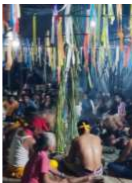
Gambar 2. Sriding

Sriding merupakan kumpulan Daun pohon pinang yang dibuat seperti Menara dan nantinya sebagai media komunikasi Kepala Belian atau Dukun Belian untuk menemukan di daerah mana asalnya makhluk gaib yang menyebabkan pasien sakit. Untuk menemukan daerah asalnya makhluk gaib, Kepala Belian berjalan mengelilingi Sriding dan menurut cerita dari kepala belian bahwa ketika mengelilingi sriding mata dan perjalanan kepala belian ini dapat menembus alam gaib walau raganya terlihat hanya berada di tempat pelaksanaan Belian. Sebagaimana yang dijelaskan dalam Tsing (2021) “The tree circling the harvest—and the one who guards the tree—is the farmer walking around the field. It is also a tree in Mecca and/or at the center of the sea. Through the rice’s journeying, the magic of distant centers is brought to one’s own rice field. The goal of the journey is to find friends and companions and to return with them and all the wealth they represent.” . dalam cerita ini terdapat perjalanan yang jauh untuk menemukan sesuatu tetapi jika dilihat dengan normal, orang tersebut hanya berada di tempat yang sama.