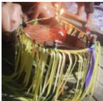
Gambar 4. Sesajen makanan dan Patung

Simbol-simbol yang digunakan dalam proses Belian seperti Sesajen makanan dan patung ditempatkan di dalam rangkaian Bambu atau biasa disebut Klengkang sebagai tempat makanan dan patung, syarat ini merupakan pengganti dari pasien yang sakit. Sebagaimana dijelaskan oleh Kepala Adat Dayak Basap Desa Keraitan yakni Pak Gagai, “pasien yang sakit dikarenakan makhluk halus atau gaib ini biasanya bagian tubuh yang sakit itu dimakan atau bahasa orang kampung ditemplei oleh makhluk gaib, sehingga sesajen makanan (Nasi Putih dan Telor) serta patung menjadi media untuk pengganti bagian tubuh yang sakit”.