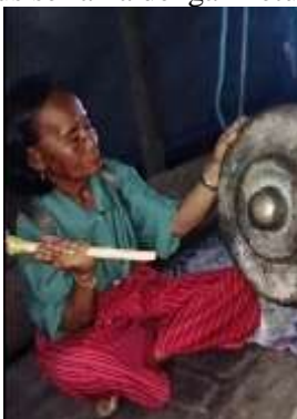
Gambar 3. Alat musik untuk memandu kepala belian mengelilingi sriding

Gong dan Gendang digunakan sebagai alat musik untuk memandu kepala belian mengelilingi sriding. Tarian mengelilingi sriding harus seirama dengan ketukan dari Gong dan Gendang.