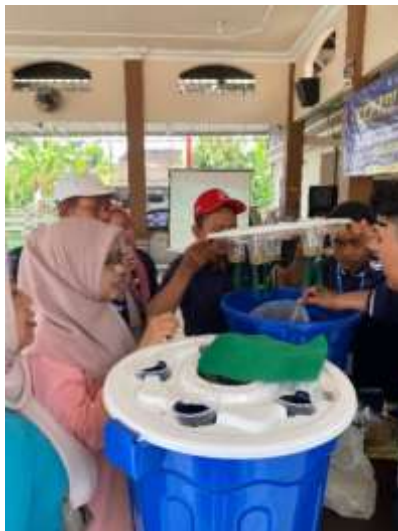
Gambar 2. Penjelasan budidaya Aquaponik

Budidaya ikan dalam ember (budidamber) yang dilakukan menggunakan wadah berkapasitas 80 liter dengan debit air kurang lebih 75 liter. Dalam satu wadah, ditebar 60-70 ekor benih ikan lele. Sebelum, dilakukan pemanenan, ikan disortir terlebih dahulu untuk memisahkan ukuran besar dan kecil, sehingga proses panen lebih terstruktur dan meminimalkan kerugian.