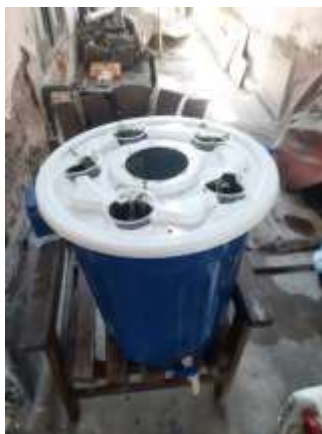
Gambar 1. Wadah Budidaya Ikan

Kran yang dipasang pada wadah budidaya ikan lele berfungsi sebagai sarana untuk mengontrol ketinggian debit air serta menjaga kualitas air yang digunakan dalam pemeliharaan ikan lele. Dengan adanya kran, sirkulasi dan penggantian air dapat dilakukan secara lebih mudah, sehingga kadar oksigen dan kebersihan media tetap terjaga. Metode ini dinilai sederhana namun efektif, terutama bagi pemula yang baru memulai kegiatan budidaya ikan lele, karena selain meminimalisir risiko kematian ikan akibat kualitas air yang menurun, juga membantu menciptakan lingkungan pemeliharaan yang lebih stabil dan berkelanjutan.