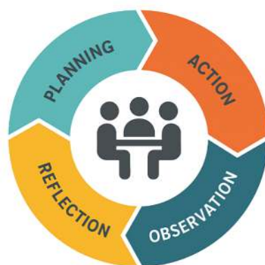
Gambar 1. Pendekatan Participatory Action Research (PAR)

Kegiatan pengabdian ini menggunakan pendekatan Participatory Action Research (PAR) sebagai landasan metodologis yang menekankan partisipasi aktif masyarakat dalam seluruh tahapan kegiatan sebagaimana terlihat pada Gambar 1. Pendekatan ini dipilih karena memungkinkan terjadinya dialog yang setara antara peneliti dan masyarakat, serta menghasilkan solusi yang aplikatif dan kontekstual (Baum et al., 2006).