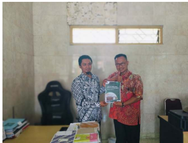
Gambar 3. Hasil dokumen rencana kerja tahunan Pokdarwis Bimo Pandowo

Kedua, dilakukan penguatan kelembagaan Pokdarwis (Kelompok Sadar Wisata) sebagai aktor kunci dalam pengembangan ekowisata desa. Melalui pelatihan kepemimpinan, manajemen organisasi, serta strategi kolaborasi antar-aktor, Pokdarwis mulai menunjukkan kemampuan menyusun rencana kerja tahunan yang lebih terarah serta menjalin komunikasi intensif dengan berbagai pihak eksternal, seperti pemerintah desa, pelaku usaha, dan lembaga akademik sebagaimana terlihat pada Gambar 3. Hal ini menandai transformasi Pokdarwis dari sekadar kelompok pelaksana menjadi motor penggerak yang memiliki visi strategis dalam memajukan wisata desa.