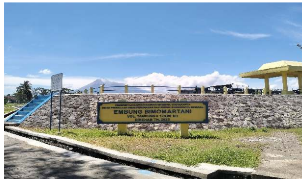
Gambar 2. Embung Bimomartani

Hasil observasi lapangan memperlihatkan bahwa Kalurahan Bimomartani memiliki beragam potensi ekowisata yang dapat dikembangkan secara strategis. Potensi tersebut meliputi Embung Bimomartani seperti terlihat pada Gambar 2 yang berfungsi sebagai pusat ekowisata berbasis air dengan daya tarik rekreasi sekaligus edukasi lingkungan, lahan pertanian organik yang berpotensi dikembangkan sebagai wisata edukasi pertanian ( agro-tourism ), serta lanskap pedesaan yang menawarkan suasana alami dan asri sebagai modal untuk menciptakan pengalaman wisata berbasis keunikan lokal. Selain itu, kekayaan budaya seperti kesenian tradisional, upacara adat, dan kuliner khas juga menjadi aset penting yang dapat memperkuat identitas ekowisata berbasis kearifan lokal (Sutopo, Sunardi, Pabbajah, Juhansar, et al., 2024).