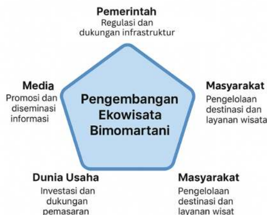
Gambar 4. Implementasi strategi pentahelix

Implementasi strategi pentahelix ini mulai menunjukkan sinergi nyata antar-aktor, yang tercermin dari meningkatnya koordinasi antara Pokdarwis dan pemerintah desa dalam penyusunan program wisata, pendampingan intensif oleh akademisi melalui kegiatan pengabdian, serta keterlibatan pemuda lokal dalam memanfaatkan media sosial sebagai sarana promosi ekowisata sebagaimana terlihat pada Gambar 2. Kolaborasi ini tidak hanya memperkuat kapasitas kelembagaan desa wisata, tetapi juga mendorong tumbuhnya inovasi dalam pengelolaan dan pemasaran destinasi. Dengan demikian, pendekatan pentahelix menjadi kerangka strategis yang mampu menjembatani berbagai kepentingan sekaligus memastikan keberlanjutan ekowisata Bimomartani melalui integrasi antara dimensi ekonomi, sosial, budaya, dan lingkungan.