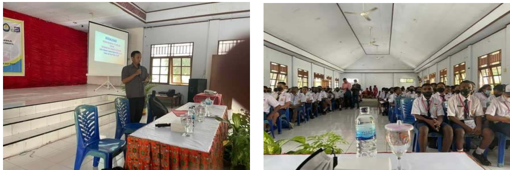
Gambar 1. Pemaparan Literasi Hukum kewirausahaan

Edukasi hukum kewirausahaan dan UMKM menunjukkan dampak positif yang sangat signifikan terhadap pemahaman siswa tentang aspek legal dalam berwirausaha. Hasil pre-test menunjukkan hanya 32% siswa yang memiliki pemahaman dasar tentang pentingnya legalitas usaha, sementara post-test menunjukkan peningkatan drastis menjadi 85%. Khususnya dalam pemahaman sistem NIB-OSS, terjadi lonjakan dari 18% menjadi 78% siswa yang mampu menjelaskan prosedur pendaftaran usaha melalui sistem online.