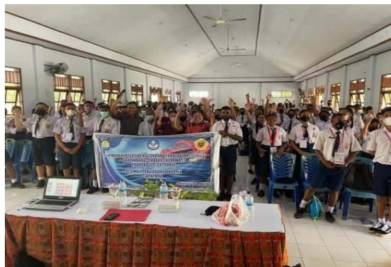
Gambar 3. Mendiskusikan Ide-Ide Bisnis

Program menciptakan momentum positif untuk pengembangan budaya kewirausahaan di SMU YPPK Taruna Darma Kotaraja. Kepala sekolah melaporkan bahwa pasca kegiatan, siswa mulai aktif mendiskusikan ide-ide bisnis dengan perspektif legalitas. Terbentuk kelompok informal yang terdiri dari 15 siswa yang berkomitmen untuk mengembangkan business plan dengan memperhatikan aspek hukum.