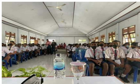
Gambar 2. Transformasi persepsi tentang kewirausahaan legal