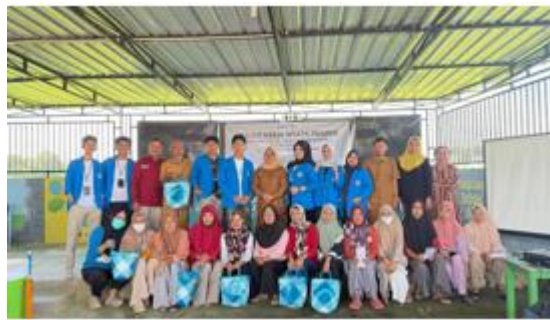
Gambar 3 pendekatan kepada masyarakat