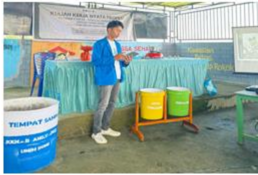
Gambar 2 pengenalan tempat sampah organik dan nonorganik