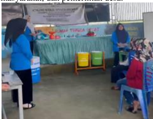
Gambar 1 sosialisasi dan penyuluhan mengenai penanganan sampah

Dengan demikian, dapat disimpulkan bahwa kegiatan KKN di Desa Tebba efektif dalam menginspirasi dan mengubah pandangan masyarakat terkait sampah. Program ini sejalan dengan prinsip pembangunan berkelanjutan (SDGs), khususnya dalam mewujudkan lingkungan yang bersih, sehat, dan lestari melalui kolaborasi antara mahasiswa, masyarakat, dan pemerintah desa.