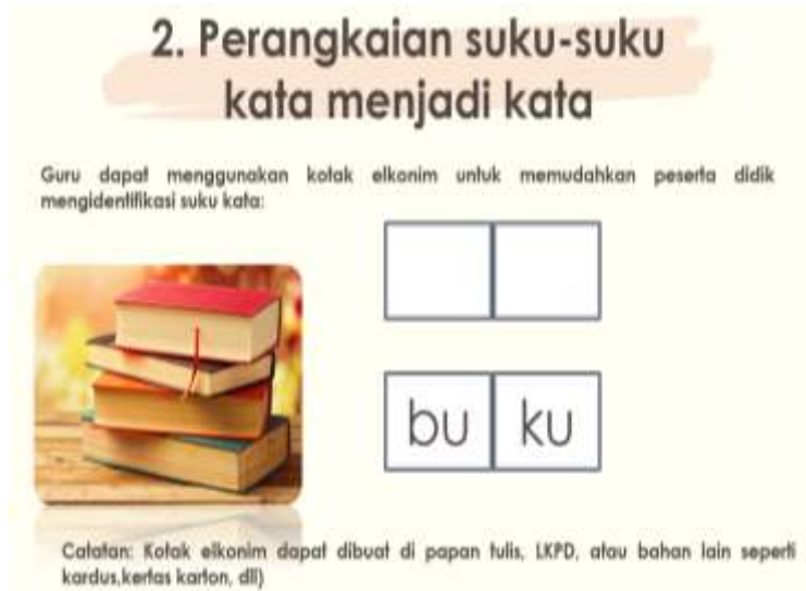
Gambar 2. Penjelasan langkah-langkah metode Silaba

Kegiatan pengabdian masyarakat dilakukan dengan menerapkan metode Brainstorming, diskusi dan tanya jawab terkait dengan berbagai macam metode yang dapat digunakan guru dalam upaya meningkatkan kemampuan membaca permulaan siswa. Selanjutnya diskusi dan tanya jawab terkait salah satu metode yang dapat digunakan dalam upaya meningkatkan keterampilan membaca permulaan yang sistematis yakni metode silaba.