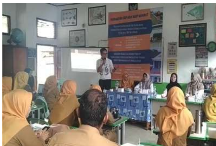
Gambar 3. Proses Penyampaian Materi

Setelah penjelasan langkah-langkah metode Silana, dilakukan simulasi/praktik langsung penggunaan metode silaba sesuai dengan langkah-langkah/sintaks yang sudah dijelaskan sebelumnya. Diakhir kegiatan dilakukan evaluasi untuk melihat seberapa jauh tingkat kepuasan peserta terkait dengan kegiatan yang telah dilakukan.