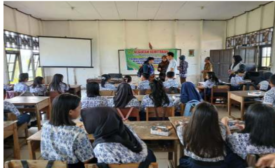
Gambar 2. Persiapan Presentasi Kegiatan Pengabdian Masyarakat

Selanjutnya, Gambar 2 mendokumentasikan suasana persiapan sebelum kegiatan dimulai di dalam kelas. Dalam tahap ini, tim dari Program Studi Pendidikan Bahasa Inggris bekerja sama secara intensif dengan pihak sekolah untuk menyiapkan segala keperluan teknis maupun non-teknis yang mendukung kelancaran pelaksanaan kegiatan. Kolaborasi ini mencakup pengaturan ruang kelas, kesiapan materi presentasi, serta koordinasi jadwal kegiatan, yang semuanya dilakukan untuk memastikan bahwa pelaksanaan program berjalan dengan tertib dan efektif.