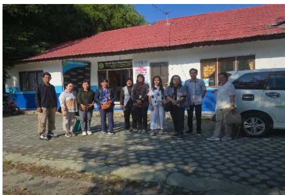
Gambar 1. Foto Bersama di depan Kantor Program Studi Sebelum Berangkat ke Lokasi Pengabdian

Bagian ini menyajikan berbagai dokumentasi kegiatan pengabdian kepada masyarakat yang telah dilaksanakan oleh tim pelaksana. Dokumentasi ini tidak hanya berfungsi sebagai bukti visual atas pelaksanaan program, tetapi juga merepresentasikan proses, keterlibatan, serta dinamika interaksi antara tim pengabdian dan mitra sasaran. Melalui dokumentasi tersebut, diharapkan pembaca, khususnya para peneliti dan praktisi, dapat memperoleh gambaran yang lebih komprehensif mengenai jalannya kegiatan, strategi pelaksanaan, serta dampak awal yang terlihat dari intervensi yang dilakukan. Penyajian ini menjadi bagian penting dalam pelaporan, karena mendukung transparansi kegiatan.