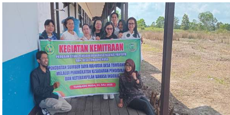
Gambar 4. Foto Bersama Setelah Selesai Laksanakan Kegiatan

Gambar 3 memperlihatkan momen ketika tim pengabdian melakukan presentasi kepada peserta didik kelas VII sebagai bagian dari rangkaian kegiatan pengabdian kepada masyarakat. Presentasi ini dirancang untuk membangkitkan minat dan meningkatkan motivasi siswa agar lebih aktif terlibat dalam kegiatan yang dilaksanakan. Melalui pendekatan interaktif dan materi yang relevan, tim berupaya menciptakan suasana pembelajaran yang menyenangkan sekaligus bermakna. Kegiatan ini sekaligus menjadi representasi awal dari tumbuhnya kesadaran peserta didik akan pentingnya mempelajari bahasa Inggris sebagai keterampilan yang dibutuhkan di era globalisasi. Dokumentasi ini menunjukkan bahwa penguatan motivasi belajar dapat menjadi langkah strategis dalam menumbuhkan semangat dan partisipasi aktif dalam proses pendidikan.