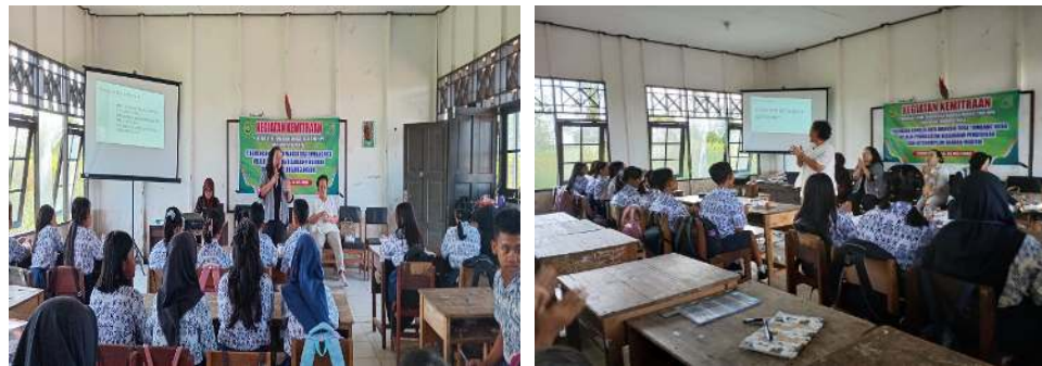
Gambar 3. Presentasi Dilaksanakan

Selanjutnya, Gambar 2 mendokumentasikan suasana persiapan sebelum kegiatan dimulai di dalam kelas. Dalam tahap ini, tim dari Program Studi Pendidikan Bahasa Inggris bekerja sama secara intensif dengan pihak sekolah untuk menyiapkan segala keperluan teknis maupun non-teknis yang mendukung kelancaran pelaksanaan kegiatan. Kolaborasi ini mencakup pengaturan ruang kelas, kesiapan materi presentasi, serta koordinasi jadwal kegiatan, yang semuanya dilakukan untuk memastikan bahwa pelaksanaan program berjalan dengan tertib dan efektif.