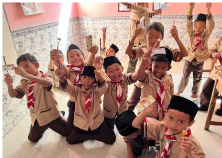
Gambar 1. Siswa Mendapatkan Reward Menabung

Proses pengabdian ini menggunakan pendekatan partisipatif-edukatif. Pendekatan ini menempatkan masyarakat sasaran (siswa, guru, dan orang tua) sebagai aktor utama dalam setiap tahap program, sedangkan tim pengabdian berperan sebagai fasilitator, pendamping, dan motivator. Tim tidak hanya memberikan instruksi, tetapi secara aktif berinteraksi dengan siswa melalui pendampingan harian dan sesi edukatif. Jenis masyarakat yang terlibat mencakup: siswa MI Islamiyah Balamoa, sebagai peserta utama; guru dan kepala sekolah, sebagai mitra pendamping keberlanjutan program; orang tua siswa, sebagai pendukung tidak langsung dalam menanamkan kebiasaan menabung di rumah. Lokasi kegiatan adalah MI Islamiyah Balamoa, Kecamatan Pangkah, Kabupaten Tegal, dengan durasi program selama 30 hari efektif.