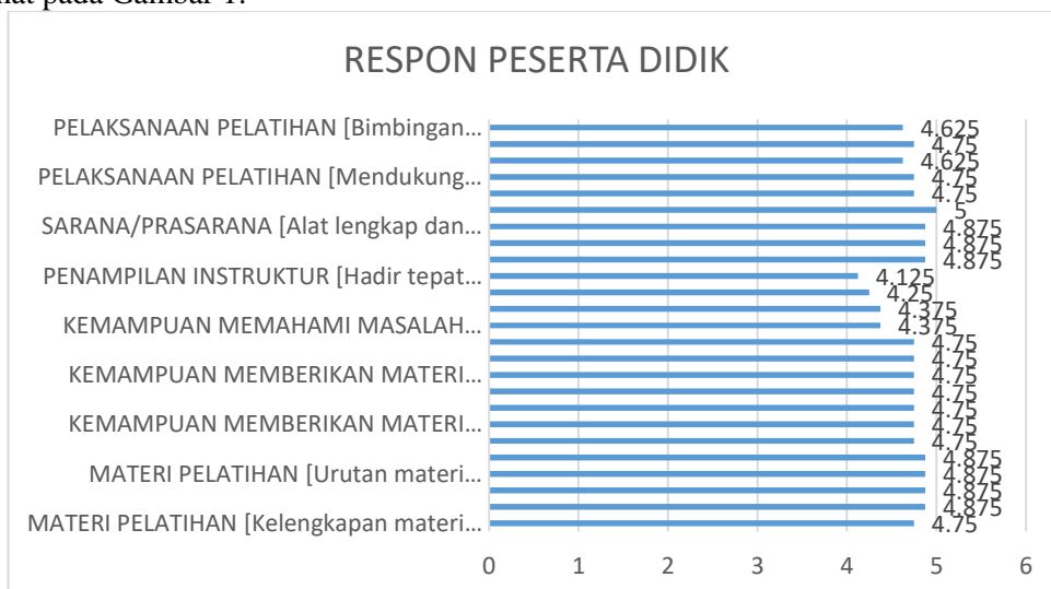
Gambar 1. Diagram batang respon siswa per indikator

Penampilan Instruktur, aspek penampilan instruktur mendapat skor bervariasi. Ketepatan waktu memperoleh skor 4,1, sedangkan indikator penggunaan pakaian kerja serta pemberian keteladanan masing-masing mendapat skor 4,9. Artinya, meskipun secara umum penampilan dinilai baik, aspek kedisiplinan waktu masih dapat ditingkatkan. Sarana dan Prasarana, peserta sangat puas dengan sarana dan prasarana pelatihan, terlihat dari skor yang sangat tinggi, yaitu 4,9 untuk kelengkapan alat serta 5,0 untuk kondisi peralatan yang baik dan siap pakai. Hal ini membuktikan bahwa fasilitas yang disediakan sangat mendukung kelancaran praktik. Pelaksanaan Pelatihan, pada aspek pelaksanaan, skor yang diperoleh berkisar antara 4,6–4,8. Pelatihan dianggap relevan dengan kebutuhan, mendukung pengetahuan baru, serta isi pelatihan mudah dikuasai. Namun, indikator bimbingan instruktur dalam praktik mendapat skor 4,6, yang meskipun baik, masih relatif lebih rendah dibanding aspek lain. Secara keseluruhan, respon peserta didik menunjukkan bahwa kegiatan pengabdian masyarakat ini berhasil meningkatkan pengetahuan dan keterampilan mereka dalam mengolah produk pangan berbahan dasar labu kuning. Materi, metode, serta sarana yang disiapkan mendapat apresiasi tinggi, sementara beberapa aspek seperti kedisiplinan waktu dan pendampingan intensif selama praktik dapat menjadi bahan evaluasi untuk pelaksanaan kegiatan di masa mendatang. Diagram batang respon siswa per indikator dapat dilihat pada Gambar 1.