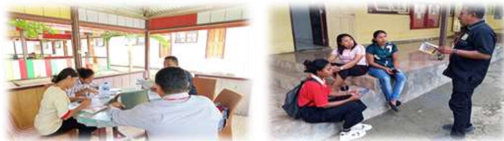
Gambar 1. Pendampingan kepada generasi muda desa Wermatang

Sesi kedua dilaksanakan pada hari Rabu, 23 Juli 2025 dengan indikator materi yang disampaikan adalah Atuf Menombaki Matahari, Lumba-Lumba dan Anak Yatim Piatu, Gadis Yang Menjadi Buaya, Ular Naga Dengan Si Bungsu, Asal Mula Sirih, Padi dan Kacang Hijau. Sebagai contoh salah satu pesan moral yang terkandung dalam cerita Lumba-Lumba dan Anak Yatim Piatu. Cerita ini mengajarkan kita untuk “jangan pernah lelah berbuat kebaikan, meskipun itu kecil, karena setiap kebaikan akan kembali kepada kita”. “Setitik pertolongan jauh lebih berharga daripada seribu simpati”. Selain itu, mengajarkan pentingnya mengendalikan amarah dan tidak memaksakan kehendak dan mengajarkan tentang besarnya cinta dan pengorbanan seorang ibu.