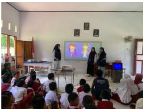
Gambar 1. Penyampaian Materi Sosialisasi Kepada Siswa SD Negeri 248 Gareccing

Temuan ini mengindikasikan bahwa siswa pada dasarnya telah memiliki fondasi empati, dan metode naratif berhasil menstimulasi kepekaan emosional mereka untuk memahami perspektif korban. Hal ini sejalan dengan temuan Nugroho (2020) yang menyatakan bahwa metode bercerita (storytelling) merupakan salah satu cara paling efektif untuk membangun kecerdasan emosional dan empati pada anak, karena memungkinkan mereka untuk memproses informasi dalam konteks yang emosional dan relevan.