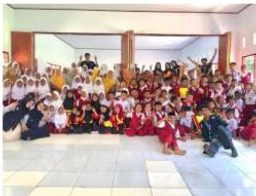
Gambar 3. Foto bersama siswa, Guru, dan tim KKN setelah kegiatan sosialisasi selesai

Hampir seluruh siswa berpartisipasi dengan suara lantang. Beberapa siswa perempuan dari kelas atas bahkan mendekati pemateri setelah sesi selesai untuk bertanya lebih lanjut. Respon ini menunjukkan bahwa edukasi yang tepat dapat memberdayakan anak untuk melindungi dirinya. Penggunaan alat peraga visual dan latihan keterampilan praktis (seperti asertivitas) merupakan komponen kunci dalam program pencegahan kekerasan seksual pada anak yang efektif, karena memberikan pengetahuan sekaligus keterampilan konkret untuk bertindak (Kurniawan & Dewi, 2022).