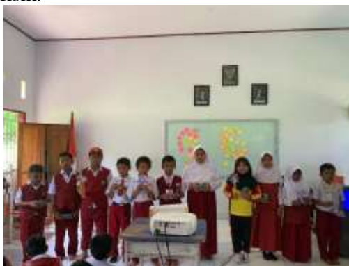
Gambar 2. Siswa menunjukkan hasil kegiatan Edukatif tentang toleransi dan keberagaman

Pada sesi yang membahas intoleransi, metode permainan "Pelangi Perbedaan" menunjukkan hasil yang positif. Awalnya, beberapa siswa cenderung berkelompok dengan teman yang memiliki kesamaan. Namun, setelah dipandu untuk saling berbagi tentang perbedaan hobi, makanan favorit, hingga cita-cita, suasana menjadi lebih cair dan terbuka. Siswa tampak menikmati proses menemukan keunikan pada diri teman-temannya. Hasil karya gambar mereka juga menunjukkan representasi pertemanan yang beragam tanpa memandang perbedaan fisik.