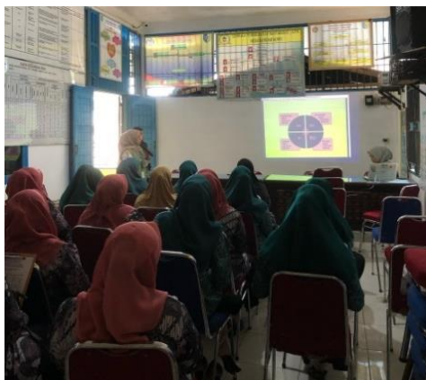
Gambar 3. Sosialisasi DAGUSIBU.

berkelanjutan sesuai dengan pedoman yang ditetapkan (Departemen Kesehatan Republik Indonesia, (2021)