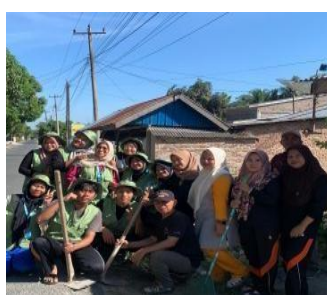
Gambar 2. Bakti Sosial