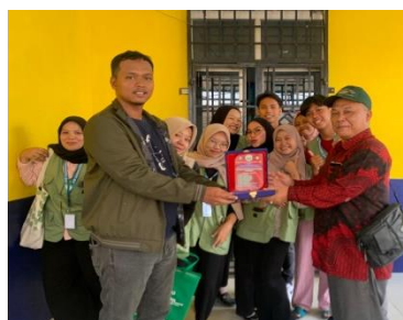
Gambar 3. Temu Pisah dgn KepalaDesa

Dari hasil pelaksanaan program Kuliah Kerja Nyata (KKN) ini, secara umum memberikan dampak yang signifikan terhadap kehidupan sosial masyarakat. Empat sektor kegiatan program prioritas tercapai dengan dengan baik dengan tingkat partisipasi masyarakat yang tinggi. Hal ini dapat diperhatikan dari beberapa uraian berikut ini: