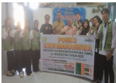
Gambar 1. Kedatangan di Desa

keragaman dalam segi ekonomi, sosial, dan sarana dan prasarana pendukung keberlanjutan desa. Mayoritas mata pencaharian penduduk adalah sebagai pekerja lepas (500 jiwa) wiraswasta (145 jiwa) dan bekerja sebagai petani (132 jiwa). Selebihnya bekerja sebagai karyawan dan Pegawai Pemerintah (Aparatur Sipil Negara).