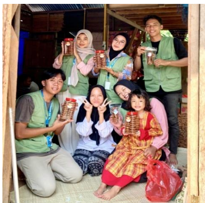
Gambar 4. Kegiatan Pemberdayaan UMKM.