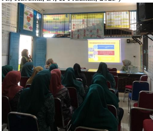
Gambar 4. Kegiatan Sosialisasi Stunting