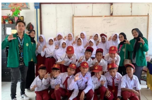
Gambar5. Sosialisasi di SDN 04 Bandarsono

Program literasi digital yang menasar 30an siswa SD Negeri 04 Desa Bandar Sono berhasil meningkatkan pemahaman mereka tentang penggunaan teknologi yang produktif dan aman. Evaluasi melalui pre-test dan post-test menunjukkan peningkatan skor rata-rata yang dari 35% menjadi 40%, khususnya dalam aspek pemahaman keamanan digital dan etika penggunaan gadget. Hal ini sekaligus menunjukkan adanya perbaikan perilaku siswa SD dalam memanfaatkan Gadget. Temuan (Mariyama et al., 2023), umumnya anak-anak menggunakan internet untuk mengakses media sosial termasuk youtube dan game daring . Guru melaporkan perubahan perilaku positif pada siswa, ditandai dengan peningkatan penggunaan gadget untuk tujuan edukatif dan berkurangnya akses ke konten yang tidak sesuai usia. Keberhasilan ini sejalan dengan rekomendasi (Pratiwi, L., & Setiawan, 2020; Isnayanti, 2025) tentang pentingnya integrasi literasi digital dalam kurikulum sejak usia dini dengan metode yang interaktif.