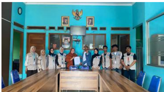
Gambar 2. Kerjasama dengan Desa Sukanagalih