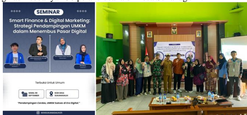
Gambar 8. Kegiatan Seminar dari Akademisi

Puncak kegiatan dilaksanakan pada tanggal 8 September 2025 berupa Seminar UMKM Level Up dengan menghadirkan narasumber dari kalangan akademisi, yaitu dosen Manajemen Keuangan dan Bisnis Digital Universitas Cipasung. Seminar ini diikuti oleh para pelaku UMKM Desa Sukanagalih sebagai bentuk penguatan kapasitas dan perluasan wawasan. Materi seminar berfokus pada pengelolaan keuangan usaha, strategi pemasaran digital, dan pentingnya legalitas usaha di era kompetitif. Jumlah pelaku usaha yang hadir sebanyak 30 pelaku usaha di Desa Sukanagalih.