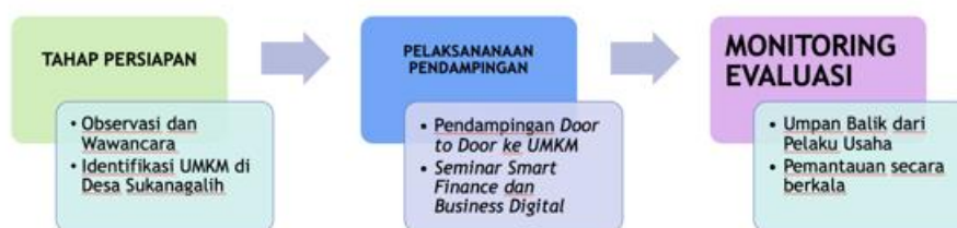
Gambar 1. Tahapan Metode Pengabdian Kepada Masyarakat

Program Pengabdian kepada Masyarakat dengan tema “ From Local to Global: Pendampingan Literasi Keuangan, Digitalisasi Pemasaran, dan Legalitas Usaha untuk UMKM Berkelanjutan ” dilaksanakan oleh KKN Universitas Cipasung di Desa Sukanagalih, Kecamatan Rajapolah, Kabupaten Tasikmalaya, pada tanggal 22 Agustus sampai 24 September 2025. Pelaksanaan kegiatan menggunakan pendekatan partisipatif dengan melibatkan langsung pelaku UMKM sebagai subjek utama. Adapun tahapan metode pelaksanaan adalah sebagai berikut: