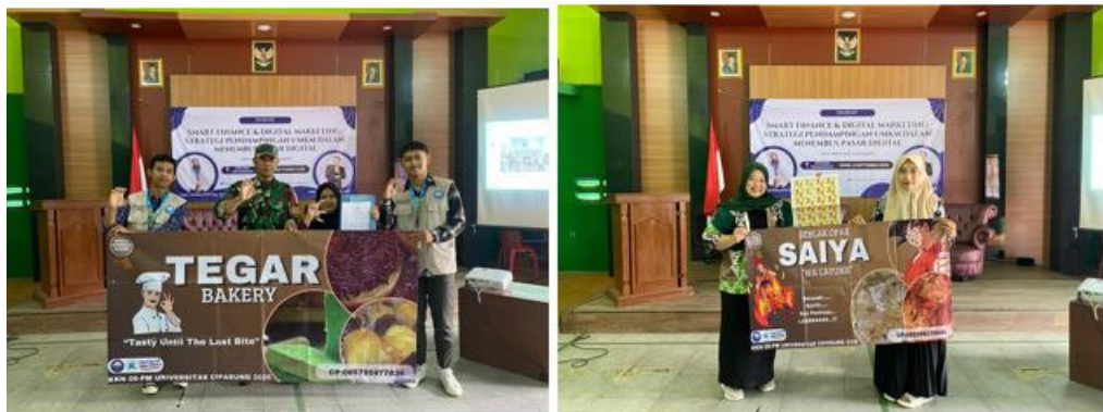
Gambar 7. Penyerahan Dokumen NIB dan Media Pemasaran Untuk UMKM di Desa Sukanagalih