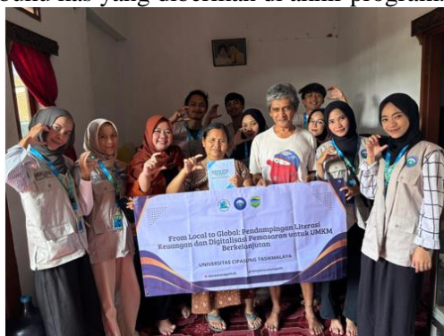
Gambar 3. Pendampingan UMKM Roti di Desa Sukanagalih

Selain itu, pelatihan pemasaran digital juga diberikan agar UMKM mampu memanfaatkan media sosial, marketplace, dan strategi branding digital. Dari hasil observasi pasca-pendampingan, sebagian pelaku usaha mulai memanfaatkan media sosial untuk promosi produk dan mencatat transaksi secara lebih terstruktur menggunakan buku kas yang diberikan di akhir program.