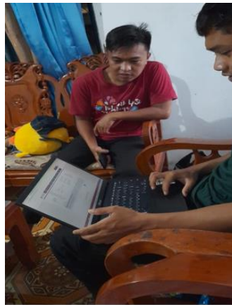
Gambar 6. Pendampingan Pembuatan NIB Anyaman Tas di Desa Sukanagalih

Fokus lain dari program ini adalah pendaftaran Nomor Induk Berusaha (NIB) bagi pelaku UMKM yang belum memiliki legalitas usaha. Dari hasil pendampingan, sebanyak 10 pelaku usaha berhasil didaftarkan dan memperoleh NIB. Legalitas ini sangat penting sebagai akses awal bagi pelaku UMKM untuk mendapatkan permodalan, mengikuti program pemerintah, serta meningkatkan kredibilitas usaha mereka