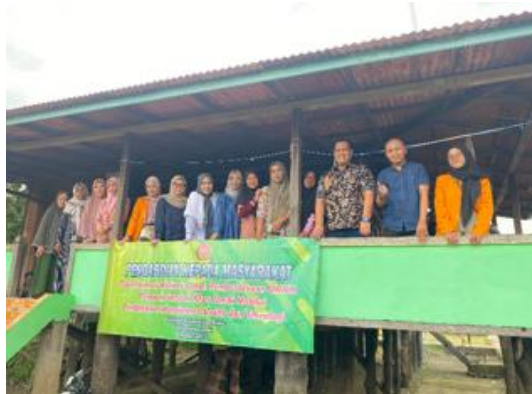
Gambar 1. Foto bersama Tim dan Peserta

Pelaksanaan kegiatan dilakukan di tempat usaha mitra yaitu usaha Pempek Sambal Linda, RT. 006 Kelurahan Olak Kemang Kecamatan Danau Teluk Kota Jambi Provinsi Jambi. Kegiatan pengabdian kepada masyarakat yang dilakukan dengan metode pelatihan ini dihadiri dengan peserta lain yang tergabung dalam Kelompok Usaha Bersama.