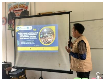
Gambar 2. Pemaparan materi

Kegiatan pengabdian ini dievaluasi melalui pendekatan kualitatif berupa wawancara dengan peserta kegiatan. Berdasarkan wawancara dengan peserta kegiatan diketahui bahwa peserta kegiatan cukup akrab dengan jenis mangrove atau bakau yang ditampilkan secara visual oleh penulis. Hal ini menunjukkan bahwa keberadaan mangrove yang digunakan dalam kegiatan ini berada di kawasan tempat tinggal peserta. Penulis kemudian menjelaskan materi terkait dengan manfaat dari mangrove sebagai tanaman pesisir yang kemudian diketahui bahwa peserta mengerti fungsi atau manfaat tanaman mangrove di pesisir hanya berupa penjaga abrasi pantai dan ekosistem tempat tinggal berbagai biota laut, “seorang peserta mengatakan: saya tahu kalau mangrove itu untuk mencegah banjir, ternyata bisa juga ya diolah menjadi teh”. Hal ini menunjukkan bahwa peserta yang merupakan masyarakat pesisir belum banyak mengetahui terkait potensi lain yang dimiliki oleh tanaman pesisir seperti daun mangrove menjadi teh herbal. Namun, setelah mengikuti serangkaian materi dan diskusi selama program pengabdian ini peserta mendapatkan pengetahuan baru terkait potensi lain yang dimiliki dari tanaman mangrove sebagai tanaman pesisir yang keberadaannya melimpah di kawasan tempat tinggalnya.