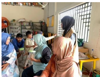
Gambar 4. Pengenalan teh herbal bunga telang