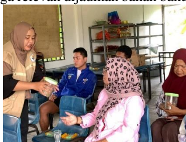
Gambar 3. Pengenalan teh herbal daun mangrove

Daun mangrove, khususnya dari spesies Rhizophora apiculata dan Rhizophora mucronata , mengandung beragam metabolit sekunder seperti flavonoid, tanin, alkaloid, fenol, dan saponin. Senyawa-senyawa ini bekerja melalui berbagai mekanisme biologis, misalnya flavonoid berperan sebagai penangkap radikal bebas dengan mendonorkan atom hidrogen untuk menstabilkan molekul oksidatif, sedangkan tanin mampu mengendapkan protein bakteri sehingga menghambat pertumbuhannya. Alkaloid diketahui mengganggu sintesis DNA dan RNA mikroba, sementara saponin berpotensi merusak membran sel bakteri dengan membentuk kompleks pada sterol. Kombinasi mekanisme ini menjelaskan mengapa daun mangrove memiliki aktivitas antioksidan, antibakteri, antiradang, hingga antikanker, sehingga relevan dijadikan bahan baku fungsional (Wardina et al., 2023).